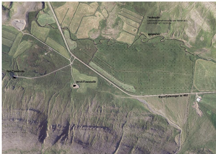
Mynd 1. Yfirlitsmynd – Afmörkun deiliskipulagssvæðis. (Teiknistofan Storð ehf, 2023).

“Landbúnaðarsvæði. Fyrirhugað er að flokka landbúnaðarland, sbr. Landsskipulagsstefna, og verður það gert í samhengi við fyrirhugaða endurskoðun á stefnu aðalskipulagsins varðandi landnotkun utan vaxtarmarka þéttbýlis, sjá I.-hluta, Inngang.”