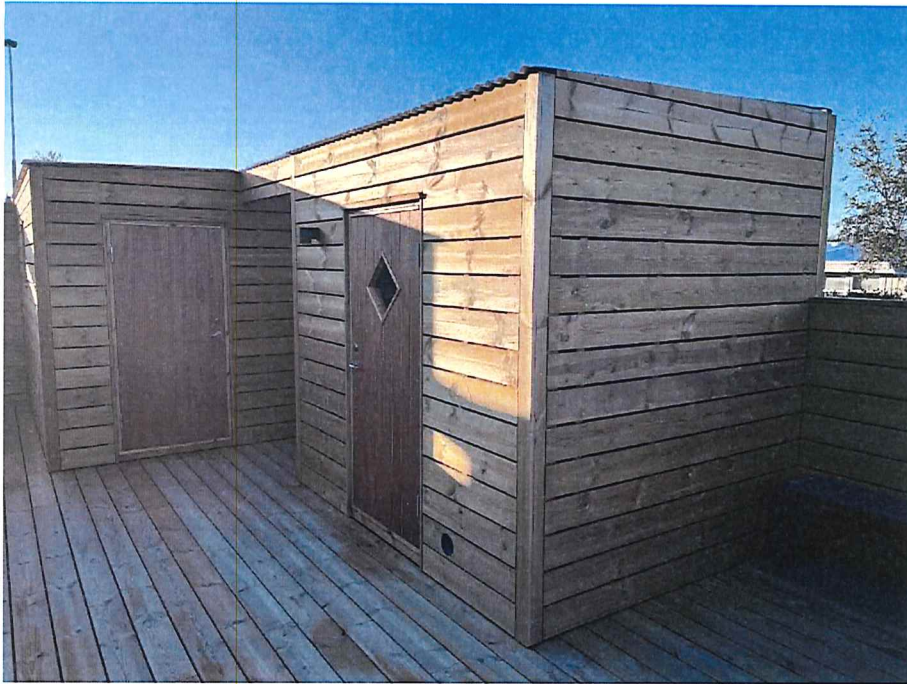
Mynd 3: Smáhýsi, grunnfletir í samtölu <math>< 15 \text{ m}^2</math>, á suðurhluta lóðar Hverafold 50, byggð sumarið 2024