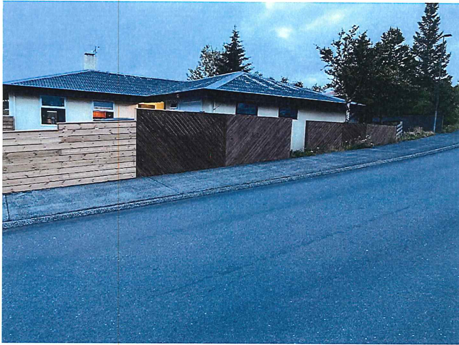
Mynd 5: Austurveggur við Hverafold 50, byggður 1992. Hæsta hæð 1,90 m og um 1,75 m yfir gólfkóta húss.

Með fyrirfram þökk fyrir jákvæða afgreiðslu þessa máls.