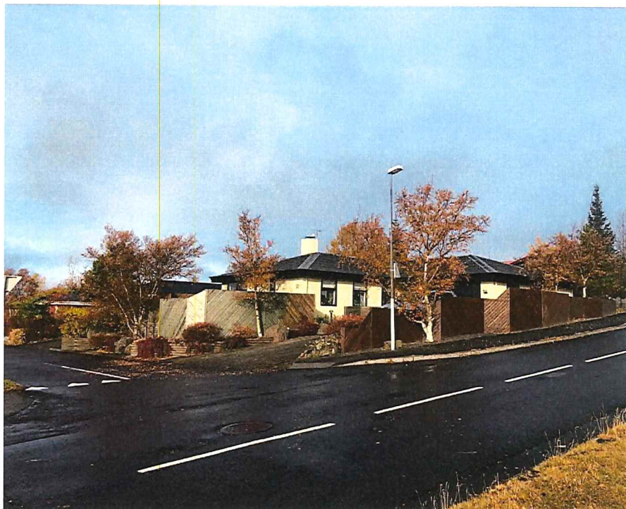
Mynd 1: Gamlir skjólveggir á suðurlóð Hverafold 50 fyrir framkvæmdir sumarið 2024

er óskað eftir heimild fyrir Hverafold 50, með deiliskipulagsbreytingu ef þörf er á, fyrir skjólveggj allt að 1,75 m yfir gólfkóta íbúðarhúss.