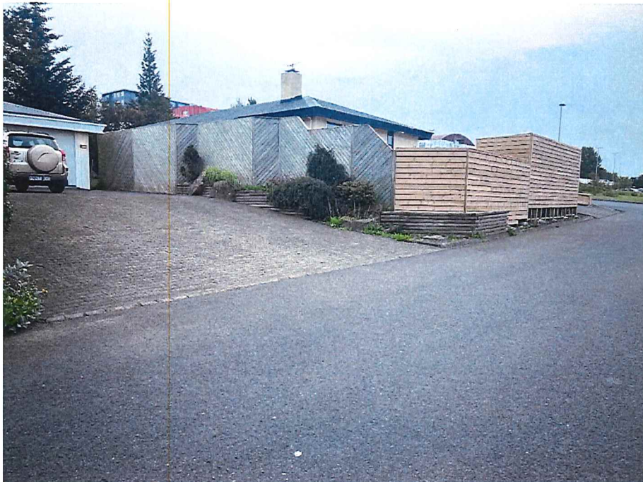
Mynd 4: Vesturveggur við Hverafold 50, byggður 1992, hæð um 2,65 m.