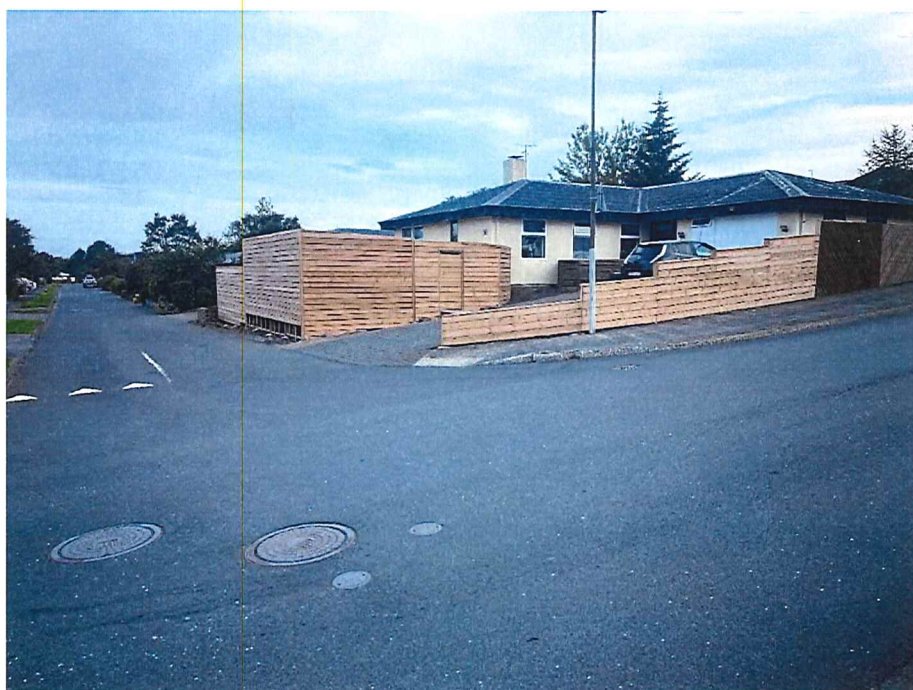
Mynd 2: Nýir skjólveggir, byggðir sumarið 2024, á suðurhluta lóðar Hverafold 50.