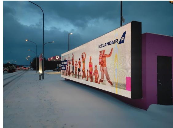
Nýja skiltið (mynd tekin 31. janúar s.l.)

Reykjavíkurborg hefur ekki vitneskju um það nákvæmlega hvenær eldra skiltið fór upp en ábendingar vegna nýja skiltisins bárust 2022.