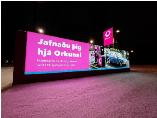
Eldra skilti

Kærandi heldur því fram að ekki sé þörf á að sækja um byggingarleyfi fyrir hinu umþrætta skilti vegna þess að áður hafi verið sambærilegt skilti á sama stað „í áratug“. Tímalengdin sem kærandi nefnir í þessu samhengi stenst ekki skoðun m.t.t. þess að veggurinn sem skilið stendur á tilheyrir vetnisstöð sem reist var árið 2019 (sjá aðaluppdrætti samþ. 14 maí 2019, fylgiskjal 27).