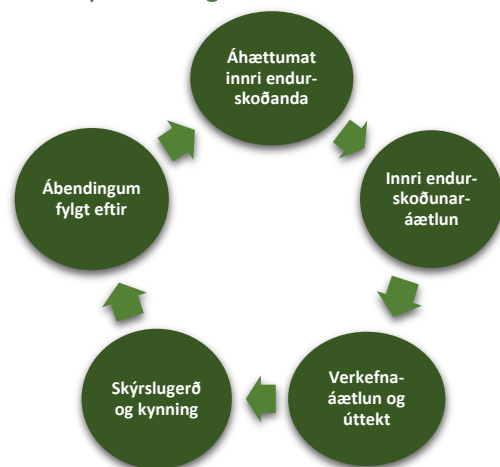
Mynd 2. Meginferli innri endurskoðunar

Áhættumatið er skilgreint í endurskoðanlegar einingar eða allar starfseiningar, ferla, stefnur og annað sem fagsvið innri endurskoðunar getur framkvæmt úttektir á. Við skilgreiningu á þessum einingum er leitast við að greina starfsemina niður í einingar sem hafa skilgreinda ábyrgðaraðila. Mat á áhættu er skilgreint sem þær ógnir og þau tækifæri sem felast í því að einhver atburður eða aðgerð hafi áhrif á að SHS nái markmiðum sínum. Áhætta er skilgreind sem fjárhagsáhætta í formi