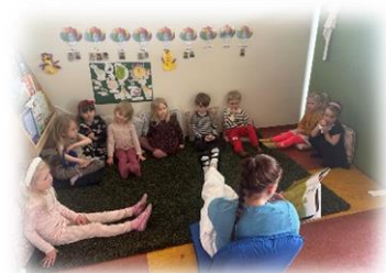
Samverustund upp í sal

Síðasta árið hefur Hagaborg verið undir smásjá hvað varðar innivist og með nánari skoðun í vetur kom í ljós að það þurfti að gera töluverðar framkvæmdir á Fiskalandi og því þurfti að loka deildinni tímabundið. Viðgerðir á deildinni drógust töluvert á langinn en deildin var lokuð alveg fram í lok ágúst 2024. Vegna þessara framkvæmda þurfti að skipta upp barnahópnum niður á nokkrar deildir og eins var íþróttasalnum breytt í eina litla deild.