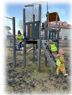
Gönguferð á leikvöll í nærumhverfi skólans.

Í ljósi þessa verður að segja að það hafi líka skapast tækifæri til að brjóta upp starfið og gera nýja spennandi hluti með barnahópnum. Útiveran var til að mynda töluvert meiri en vanalega og eins var reglulega farið í skemmtilegar vettvangsferðir í nærumhverfinu. Leikurinn fékk einnig meiri tíma og var virkilega gaman að fylgjast með barnahópnum í skapandi leikjum.