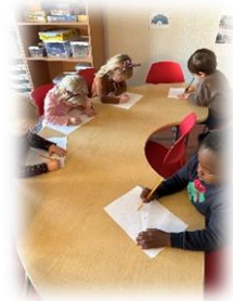
Verkefnavinna í hópastarfi.