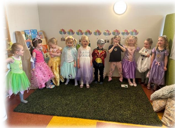
Búningadagur upp í sal 😊

við getum glöð unað eftir veturinn þó það sé alltaf hægt að gera betur en barnahópurinn var almennt ánægður og myndaði sterk félagsleg tengsl sín á milli og foreldrasamstarfið var traust.