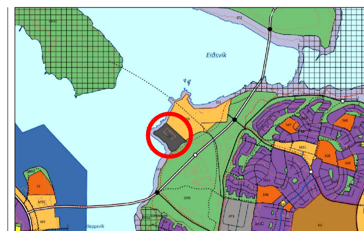
Hluti Aðalskipulags Reykjavíkur 2040