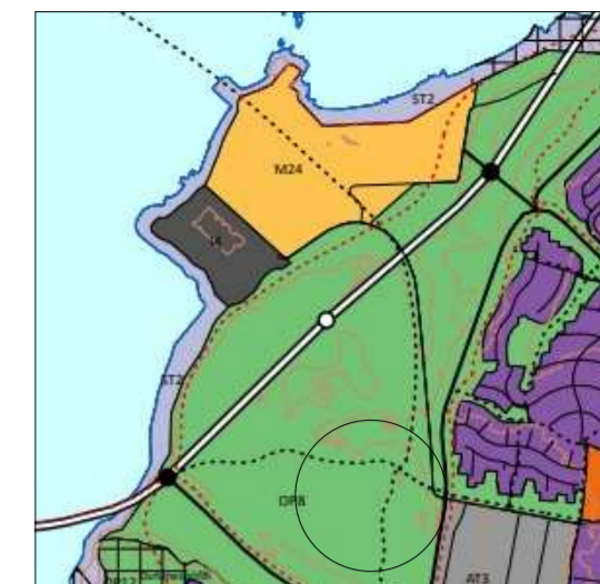
Hluti af aðalskipulagi Reykjavíkur 2040.