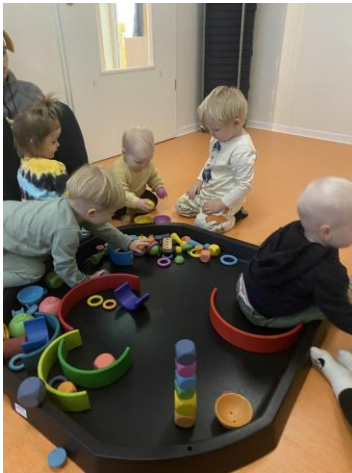
Frjáls leikur á Nauthólsvegi

Næsta skólaár munu 2018 börnin í Grandaborg ásamt fjórum starfsmönnum sameinast 2018 árgangi leikskólanum Gullborg. Við verðum áfram með aðstöðu í húsinu hjá Hagaborginni, þar verða 19 börn af Grandaborg og við fáum til okkar 12 börn frá Hagaborg. Mikil samvinna verður því áfram milli leikskólanna og stjórnendur og starfsfólk jákvætt, við sjáum fyrir okkur að aukinn stöðugleiki verði næsta skólaár en gert er ráð fyrir því að við getum snúið aftur í okkar hús Boðagranda 9 haustið 2024.