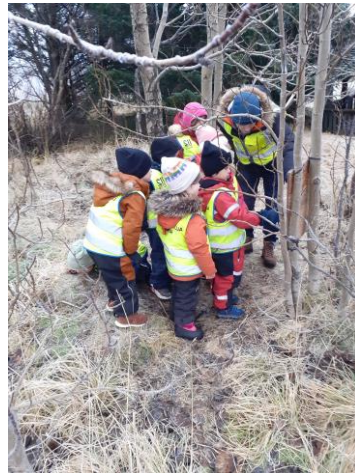
Frjáls leikur í útiveru Klettavík