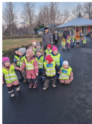
Öldu- og Skeljavík í heimsókn í vettvangsferð