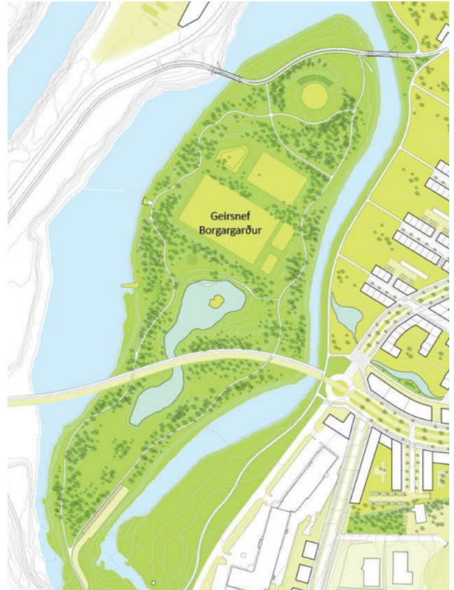
Rammaskipulag fyrir Ártúnshöfða

Geirsnef Skipulagslýsing vegna breytingar á deiliskipulagi