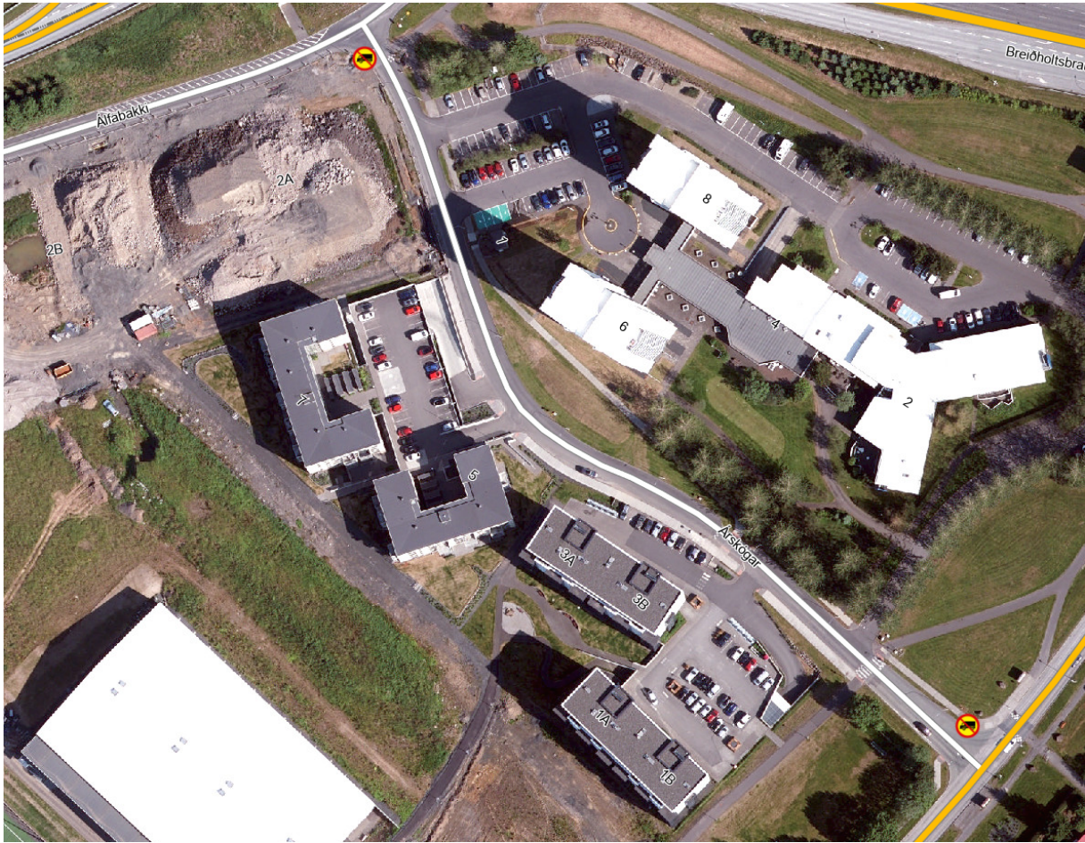
Yfirlitsmynd af Árskógum með fyrirhuguðum aðalmerki, á myndina vantar undirmerki sem gefur til kynna undanþágu.

Hjálagt: Yfirlitsmynd af Árskógum með fyrirhuguðum merkingum