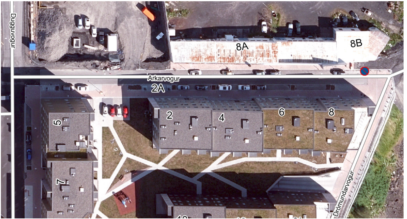
Yfirlitsmynd merkt með fyrirhuguðu umferðarmerki