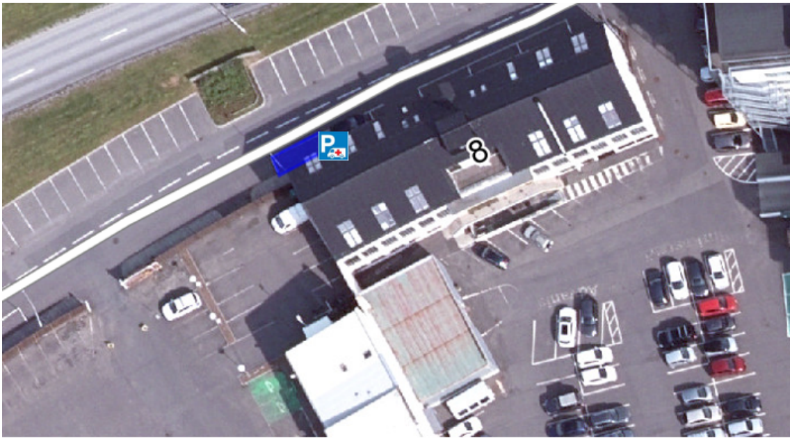
Yfirlitsmynd merkt með fyrirhugaðri staðsetningu og umferðarmerkjum