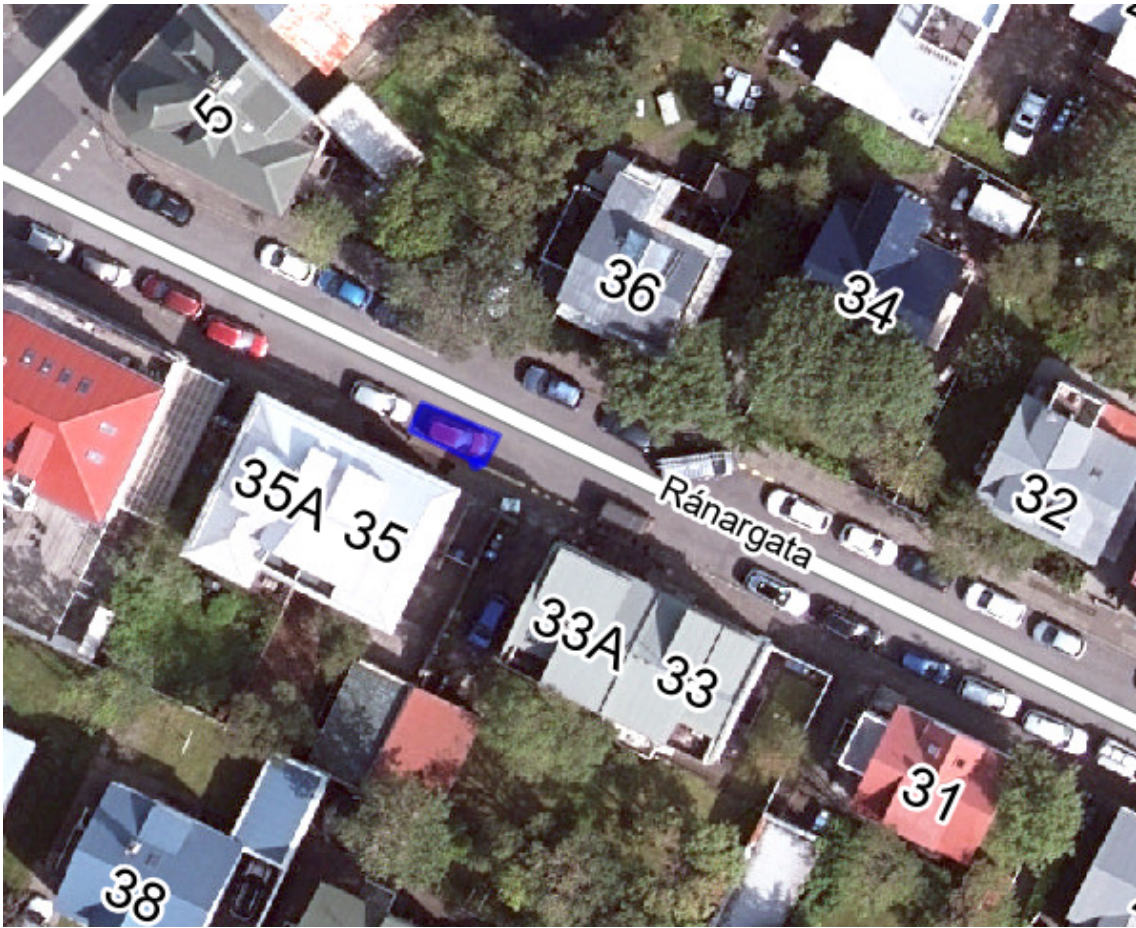
Yfirlitsmynd með fyrirhugaðri staðsetningu stæðisins merktu inn á