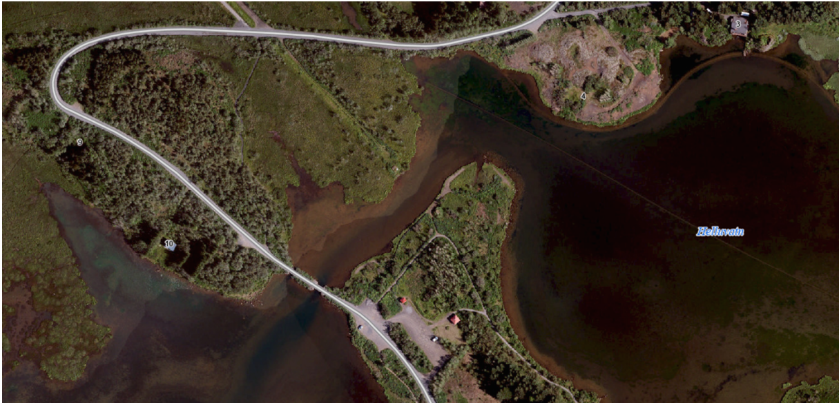
Staðsetning brúnna yfir Helluvatn