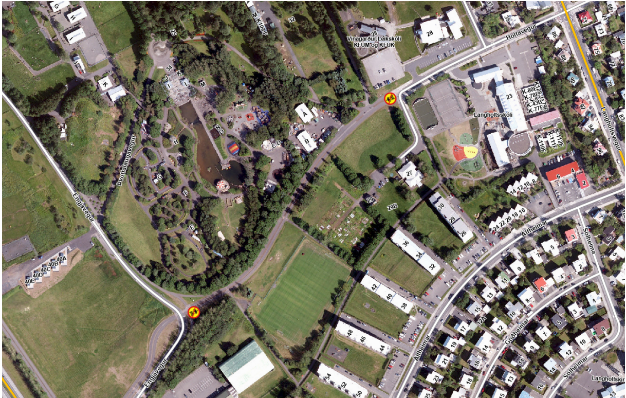
Mynd 1 - Tillaga að merkingu bans við akstri vélknúinna ökutækja á stíg milli Holtavegar og Engjavegar. Á myndina vantar undirmerki við Holtaveg sem heimilar akstur vegna Fjölskyldu- og húsdýragarðsins.