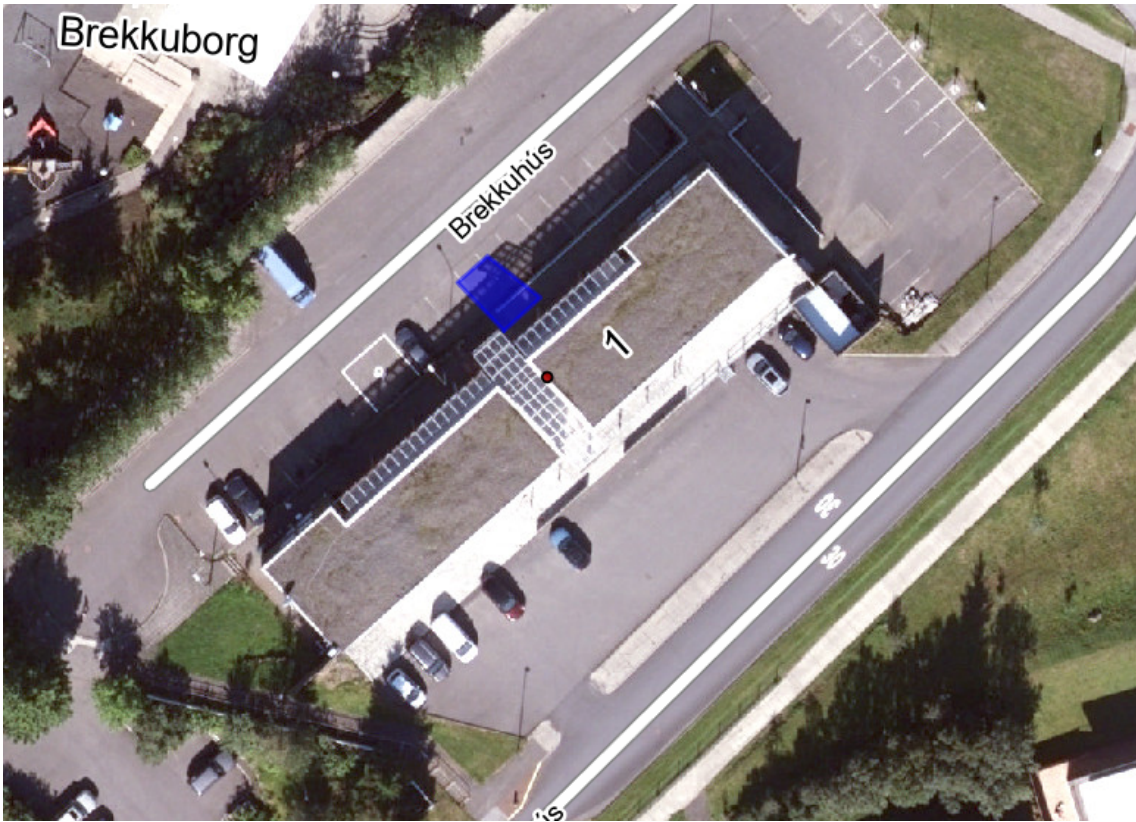
Tillaga að staðsetningu stæðisins. Endanleg útfærsla fer eftir aðstæðum