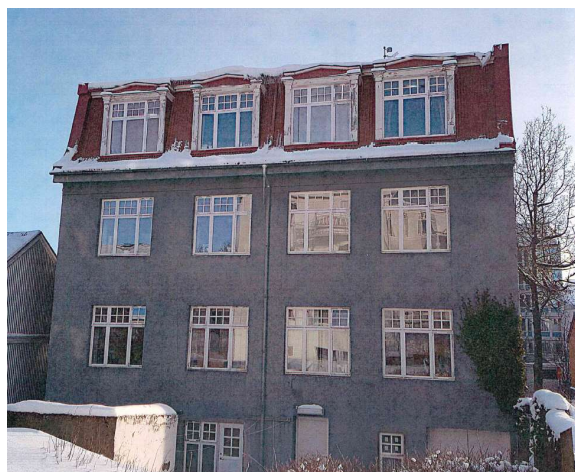
Bakhlíð hússins fyrir og eftir breytingar