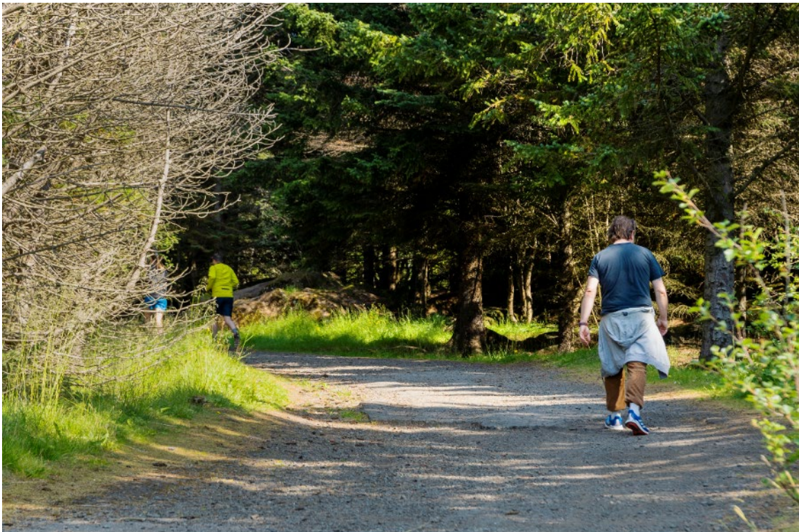
Mynd 8: Mannlíf og trjágróður í Öskjuhlíð.