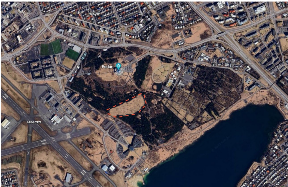
Mynd 4: Hér er mynd sem gefur hugmynd um hversu stór hluti skógarins hverfur verði felld samtals 1200 tré innan aðflugsflatarins sem er varakrafa Isavia. Grafísk mynd: Reykjavíkurborg.