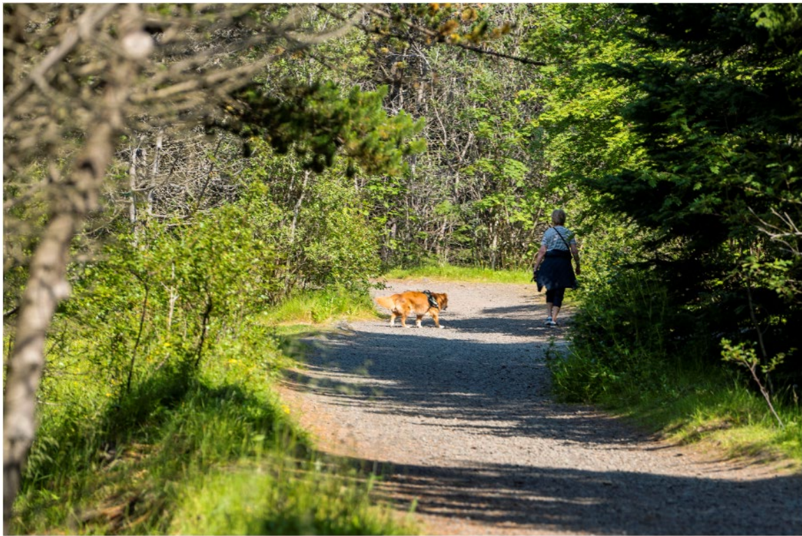
Mynd 7: Mannlíf og trjágróður í Öskjuhlíð.