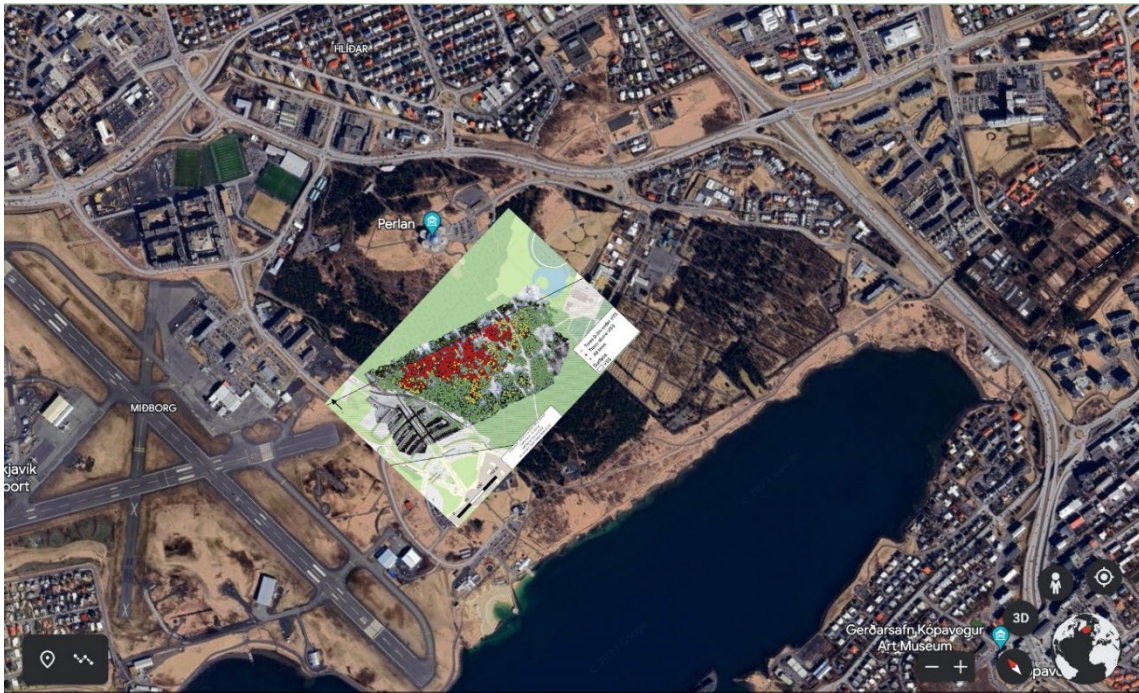
Mynd 5: Hér hefur grafísk mynd Isvia, sem notuð er til grundvallar fyrir grafískar myndir Reykjavíkurborgar, verið skeytt saman við loftmynd úr Borgarvefsjá. Samsett mynd: Reykjavíkurborg.