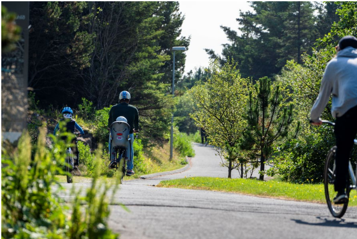
Mynd 6: Mannlíf og trjágróður í Öskjuhlíð.