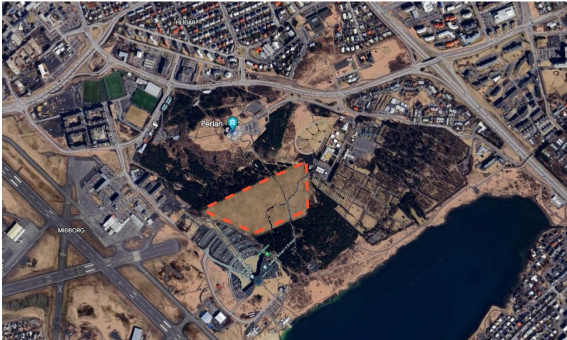
Mynd 3: Hér er mynd sem gefur hugmynd um þann hluta skógarins í Öskjuhlíð sem hverfur eftir að búið er að fella öll tré innan aðflugsflatarins, u.þ.b. 2900 tré, samkvæmt kröfu Isavia. Skógurinn sem hverfur er innan rauða afmarkaða svæðisins. Grafísk mynd: Reykjavíkurborg.