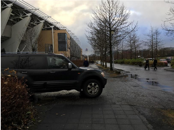
Mynd 4: Hér má sjá bílstjóra keyra út um syðri inn/útkeyrslu. Töluverð umferð gangandi vegfarenda sést einnig.