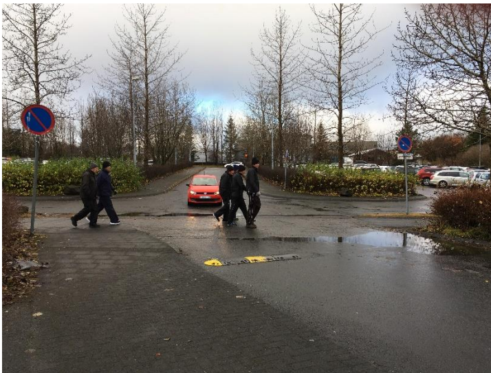
Mynd 5: Hér má bílstjóra keyra inn um syðri inn/útkeyrslu. Hann bíður meðan gönguhópur eldri borgara nýtir stígin. Á myndinni má einnig sjá hvernig bílaumferð kemur beint af Reykjavegi og inn á bílastæðið án hindrunar og án nokkurra merkinga.

Sumir bílstjórar virðast ekki átta sig á því að þeir eru að keyra yfir göngustíg, sem er að einhverju leyti skiljanlegt þar sem merkingum er verulega ábótavant og ekkert sem gefur öikumönnum til kynna að þarna sé um að ræða göngustíg.