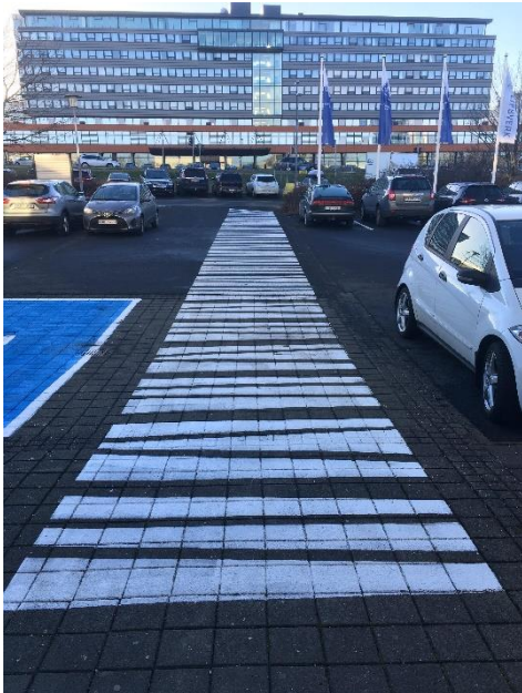
Mynd 6: Göngustígur skýrt málaður á bílastæði fyrir utan hús Verkfræðingafélagsins við Engjateig.

Dæmi um skýrar götumerkingar göngustígs: