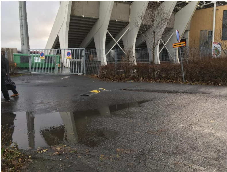
Mynd 2: Hér má sjá leifar hraðahindrunar við syðri inn/útkeyrslu

Alvarlegt er að hraðahindranir sem settar hafa verið upp við báðar inn/útkeyrslur, hafa legið skemmdar í lengri tíma, án þess að Reykjavíkurborg eða eigendur fyrirtækja í kring aðhafst. Hraðahindranirnar liggja innan við göngustíginn og gera því ekkert til að hægja á bílum sem koma keyrandi niður frá Reykjavegi.