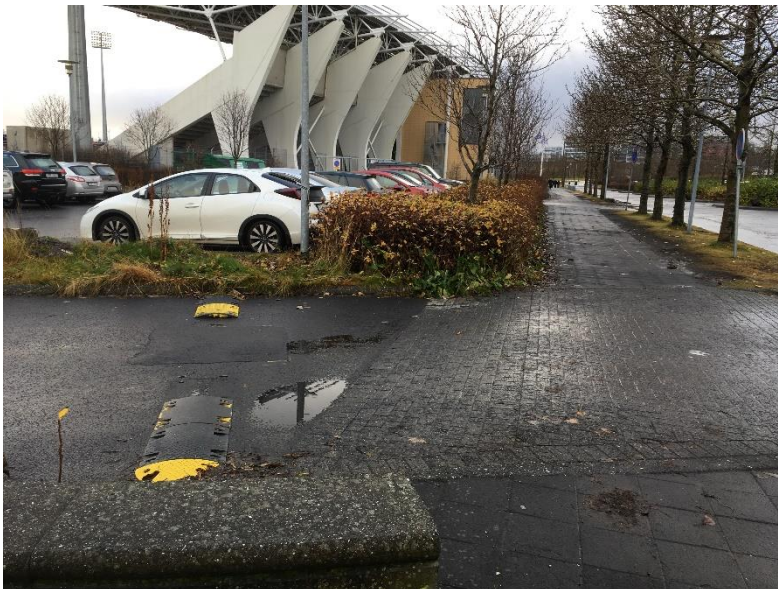
Mynd 3: Hér má sjá leifar hraðahindrunar við nyrðri inn/útkeyrslu