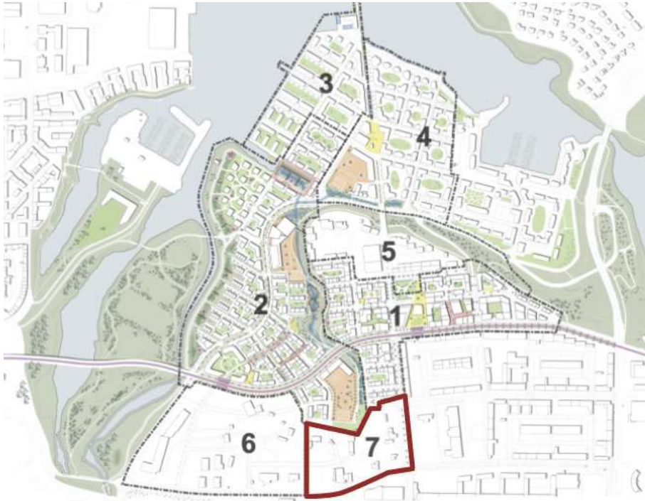
MYND 5 Yfirlitsmynd yfir áfangaskiptingu deiliskipulagsáætlana, skipulagssvæði sem hér um ræðir er merkt nr. 7 á mynd.

Svæðið hallar töluvert til norðurs frá Bíldshöfða. Á norður hluta skipulagssvæðisins er hlaðinn stoðveggur á bilinu 8-9 m sem afmarkar töluverðan hæðarmun landi. Svæðið er mjög raskað, stærstu hluti þess er í dag nýttur undir starfsemi B.M.Vallá. Innan svæðisins er gróinn og vel hirtur trjálundur, Fornilundur, sem er í eigu og umsjón B.M.Vallá. Í góðum tengslum við Fornalund eru tvær byggingar, önnur sem hýsir skrifstofur B.M.Vallá og hin söluskrifstofur B.M.Vallá.