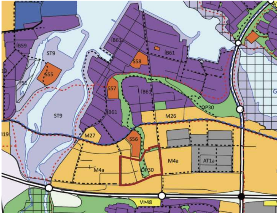
MYND 8 Landnotkun samkvæmt Aðalskipulag Reykjavíkur 2040.

Í töflu 3.1. í Aðalskipulag Reykjavíkur 2040, eru tilgreind svæði fyrir nýja íbúðarbyggð, á svæðinu Bíldshöfði (M4a) er gert ráð fyrir hámark 2-8 hæða húsum.