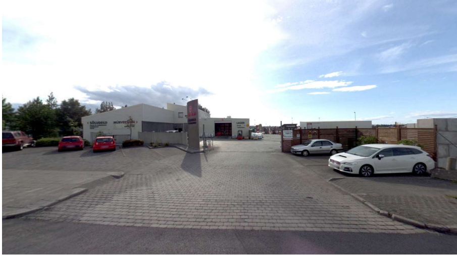
MYND 4 Aðkoma að söluskrifstofa B.M. Vallá – séð frá Breiðhöfða.