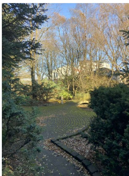
MYND 6 Fornilundur.