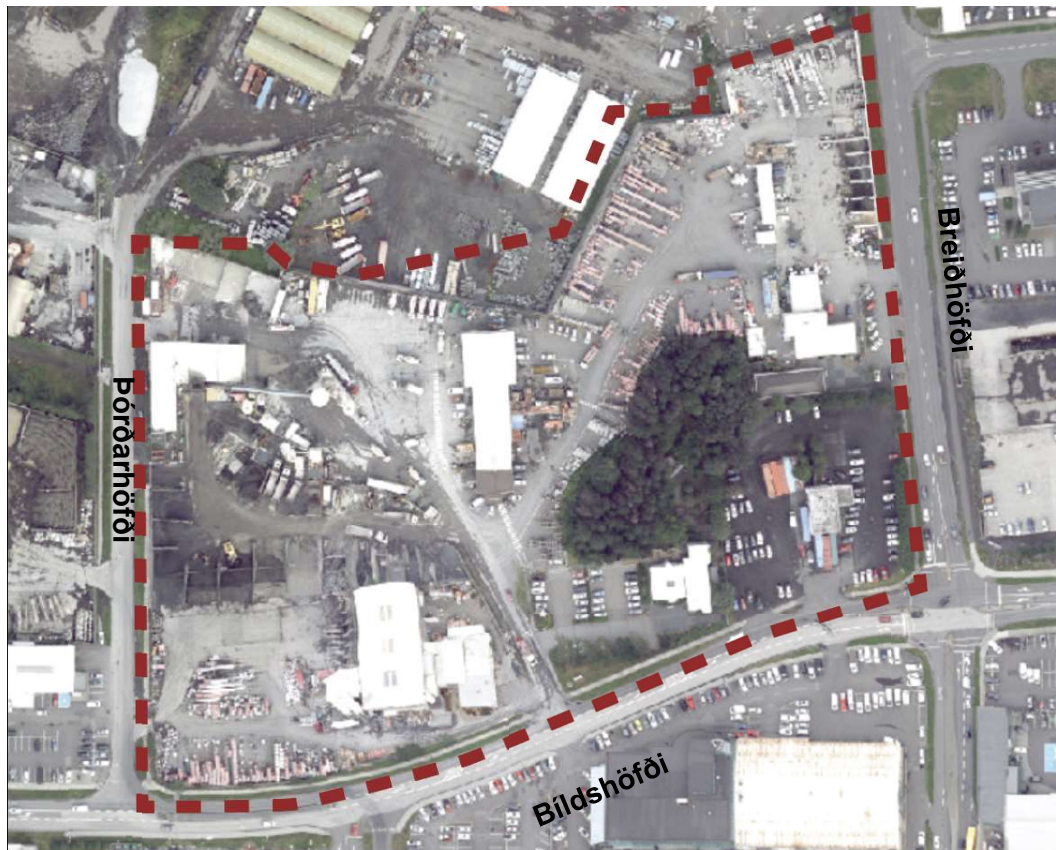
MYND 2 Afmörkun skipulagssvæðisins sýnd á loftmynd.

Svæðið afmarkast af Bíldshöfða til suðurs, stoðvegg til norðurs (deiliskipulagsmörkum áfanga 1 og 2 skv. rammaskipulagi Elliðaárvoogs-Ártúnshöfða), Breiðhöfða til austurs og Pórðarhöfða til vesturs. Aðkoma að svæðinu er frá Bíldshöfða, Breiðhöfða og Pórðarhöfða.