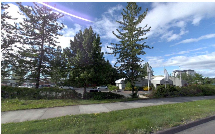
MYND 3 Skrifstofubygging B.M. Vallá – séð frá Bíldshöfða.

Svæðið afmarkast af Bíldshöfða til suðurs, stoðvegg til norðurs (deiliskipulagsmörkum áfanga 1 og 2 skv. rammaskipulagi Elliðaárvoogs-Ártúnshöfða), Breiðhöfða til austurs og Pórðarhöfða til vesturs. Aðkoma að svæðinu er frá Bíldshöfða, Breiðhöfða og Pórðarhöfða.