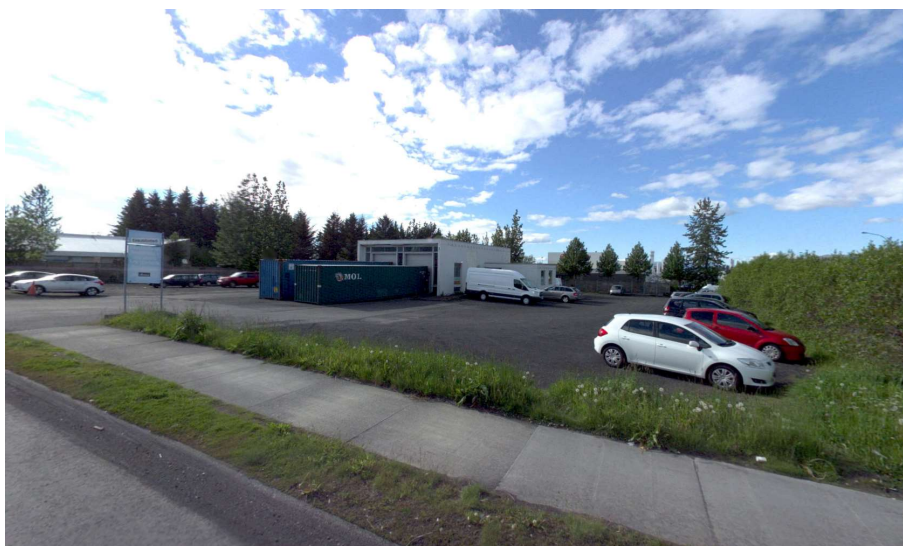
MYND 7 Á suðaustur horni svæðisins stóð bygging frá árinu 1973 sem áður hýsti slökkvistöð en hefur verið rifin.