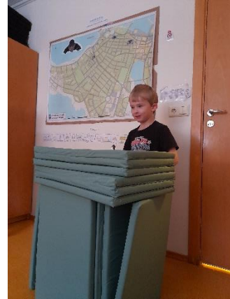
Tjáning: Börnin, koma uppá svið, segja sögur, Syngja og fara yfir helgina. Fjölbættar æfingar sem miða að því að stíga inni óttan sem opinberun kann að kalla fram og auka þannig sjálfstraust í framkomu. Áhorfendur, æfa sig í að bera virðingu fyrir þeim sem hefur orðið og gefa athygli.

Við tjáum okkur að stórum hluta með orðum. Orðin eru verkfæri til að tjá hug sinn og líðan. Börn deildarinnar eru misjafnlega langt á veg komin í málþroska. Til að lágmarka átök og hámarka vellíðan barnanna var tekin sú stefna að vinna markvisst að því að koma fyrir málörvun alstaðar þar sem færi væri á. Þetta byggir á samstilltu átaki allra á starfsmanna deildarinnar. Öll börn fá að lágmarki 20 mínútur lestur á dag, starfsmenn setjast niður með börnum í matsal snæða og spjalla um borðsiði, dægurlagatextar brotnir og sniðug orð skoðuð, Vísur í samveru, söngur í 30 mín á dag, orðasturtan og tjáningarleikir. Við ræddum ólík tungumál og staðsetningu landa á jarðkringlunni, menningu og fjarlægðir. Samhliða því lærðum við að segja góðan daginn á móðurmáli allra barna á deildinni eða á 7 mismunandi vegu.