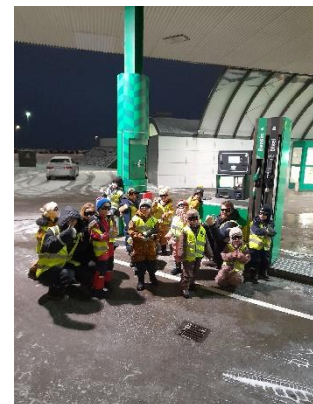
Hin margvíslegu mission. Nærumhverfið býður uppá ótal möguleika. Lagt var í leiðangur í hverri viku í allan vetur.