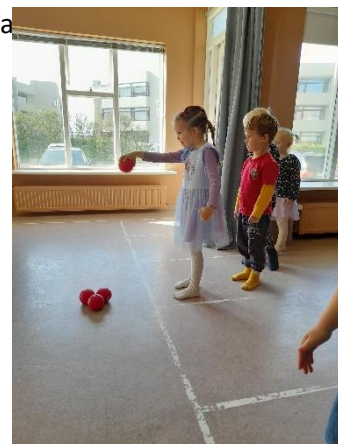
Í Vetur hafa börnin fengið að kynnst. Bocha, Animalflow, Capueira, Brazilian Jiu jitsu, fimleikum, teygjum, Joga, Hip Hop dansi og fjölmörgum leikjum.

Aflagranda. Deildinni var skipt niður í tvo hópa og var haldið af stað í „íþróttapartý“ annarsvegar mánudaga og hins vegar þriðjudaga klukkan 13. Með þessari viðbót gafst deildarstjóra tækifæri til að halda úti markvissri hreyfiflæðisþjálfun þar sem börnunum var gefið rými til að rannsaka ólíka beitingu líkamans, kynnst eigin getu og smá saman fór sjálfstraust að eflast og forvitni að aukast. Kennarar lögðu áherslu á að kenna eitthvað sértækt í hverjum tíma, þjálfa og nota þetta tækifæri til að leysa um orku, hrósa og hjálpa börnunum í að takast á við allar þær fjölmörgu tilfinningar sem leysast úr læðingi þegar stór hópur hreyfir sig saman. Það er einlæg trú deildarstjóra að betur má gera þegar kemur að dans, tónlistar og hreyfiþjálfun barna á yngsta stigi menntakerfisins. Sigrarnir voru stórir en þegar líða tók mars mánuð urðu ferðir fátíðari.