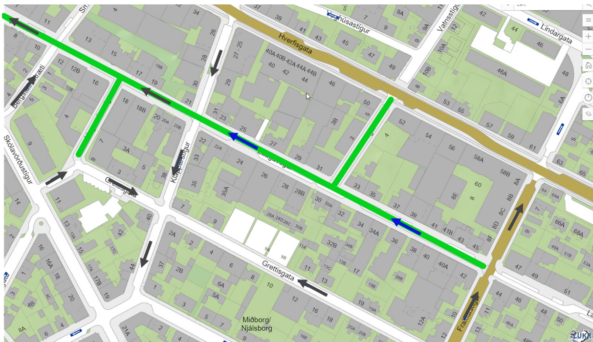
Yfirlitsmynd. Grænt: Núverandi göngugata. Gráar örvar: Núverandi akstursstefnur. Bláar örvar: Tillaga að breyttum akstursstefnum. (borgarvefsjá)

Um er að ræða göngugötu þar sem umferð vélknúinna ökutækja er almennt óheimil en akstursstefna er skilgreind fyrir þau ökutæki sem í samræmi við 10. gr. umferðarlaga, eru undanþegin því banni t.a.m. vegna vöruafhendingar og handhafar stæðiskorts fyrir hreyfihamlaða. Akstursstefna þeirra sem heimild hafa til að aka göngugötu verður þá með þeim hætti sem myndin að neðan sýnir.