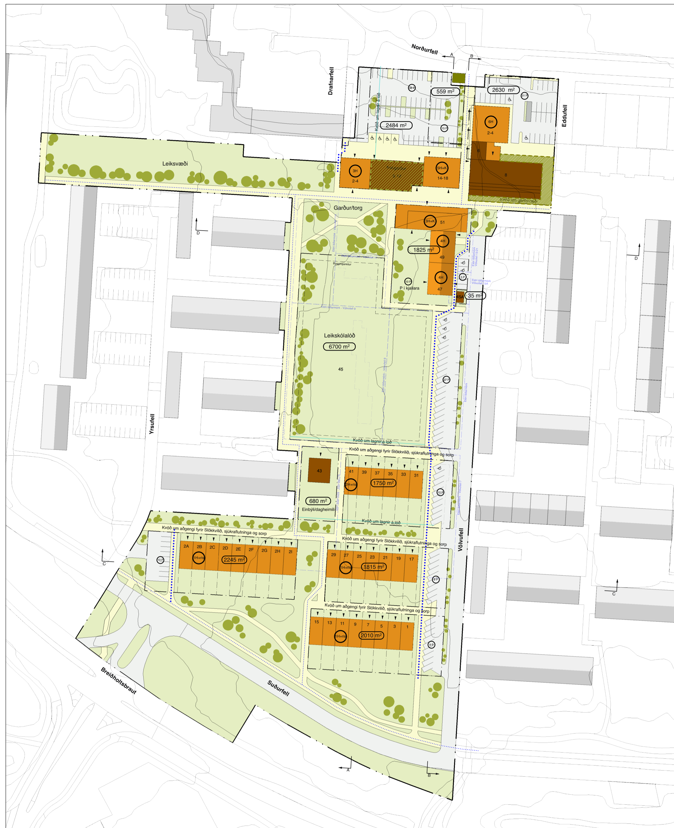
Deiliskipulagsbreyting Völvufell 1:1000