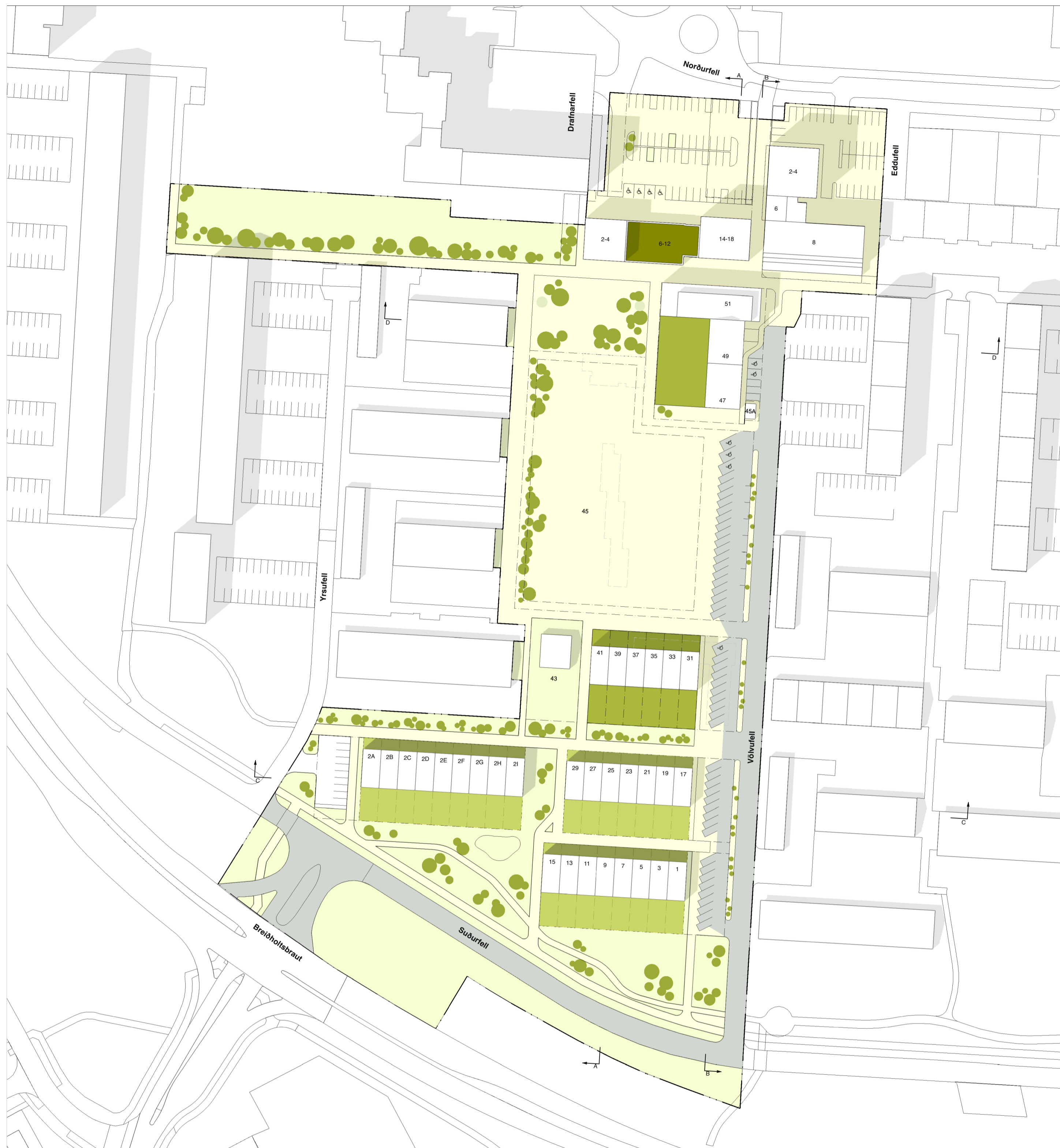
Skýringarmynd Völvufell 1:1000