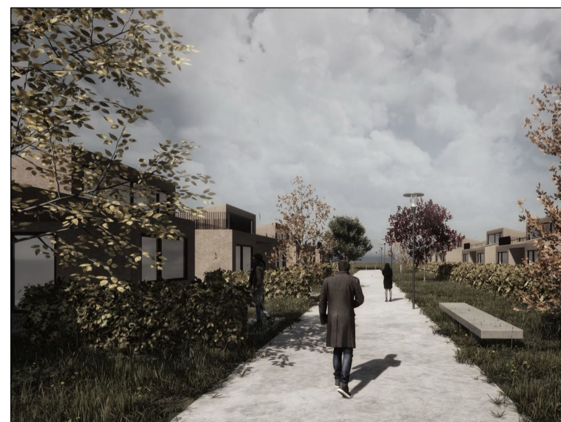
Perspektíf - horft til vesturs eftir göngustíg á milli raðhúsa