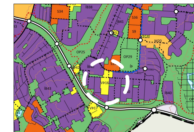
Hluti Aðalskipulags Reykjavíkur 2040