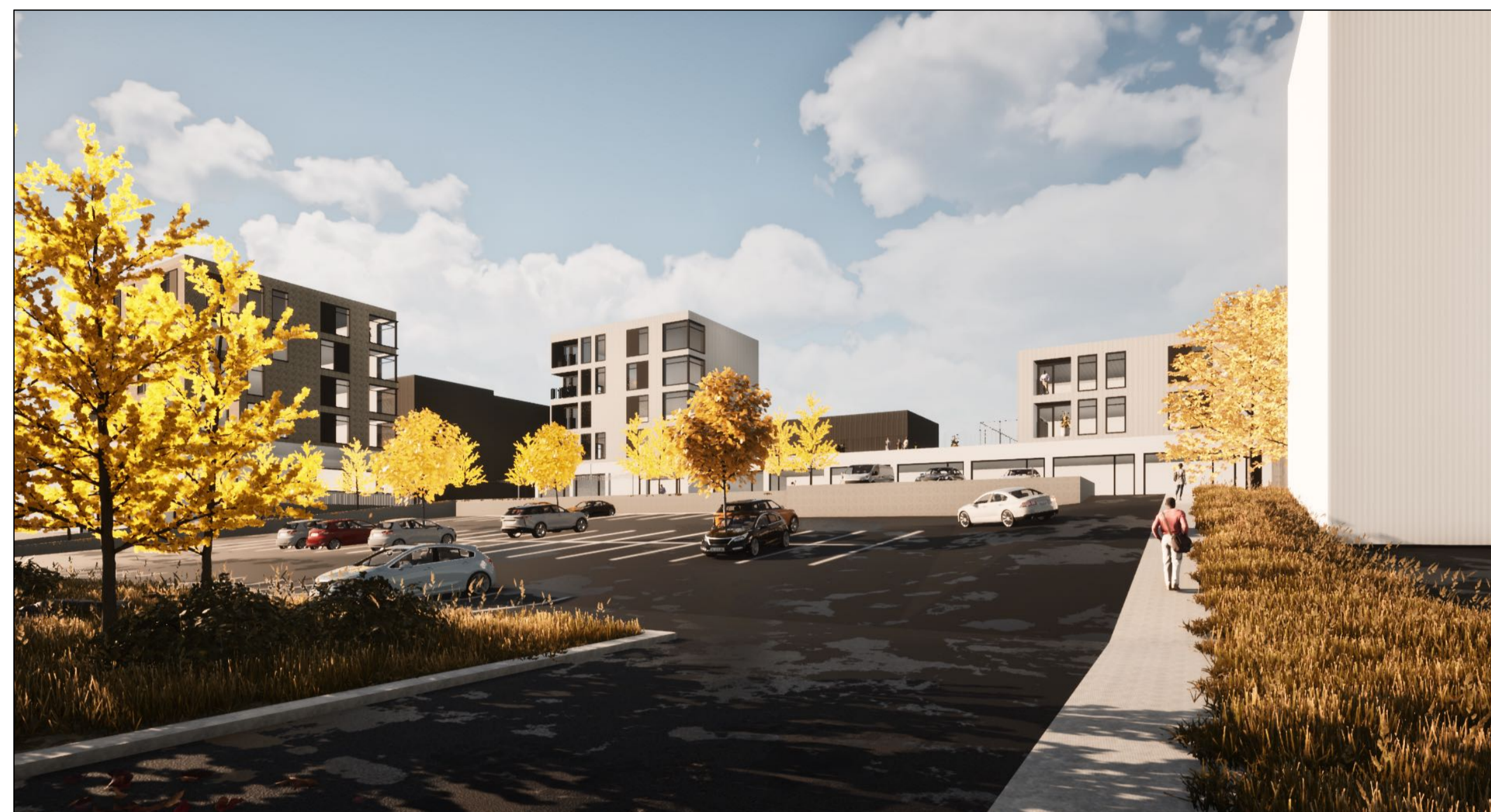
Perspektíf - horft til suðausturs á átt að Drafnarfelli frá Norðurfelli (Fellagarðar)