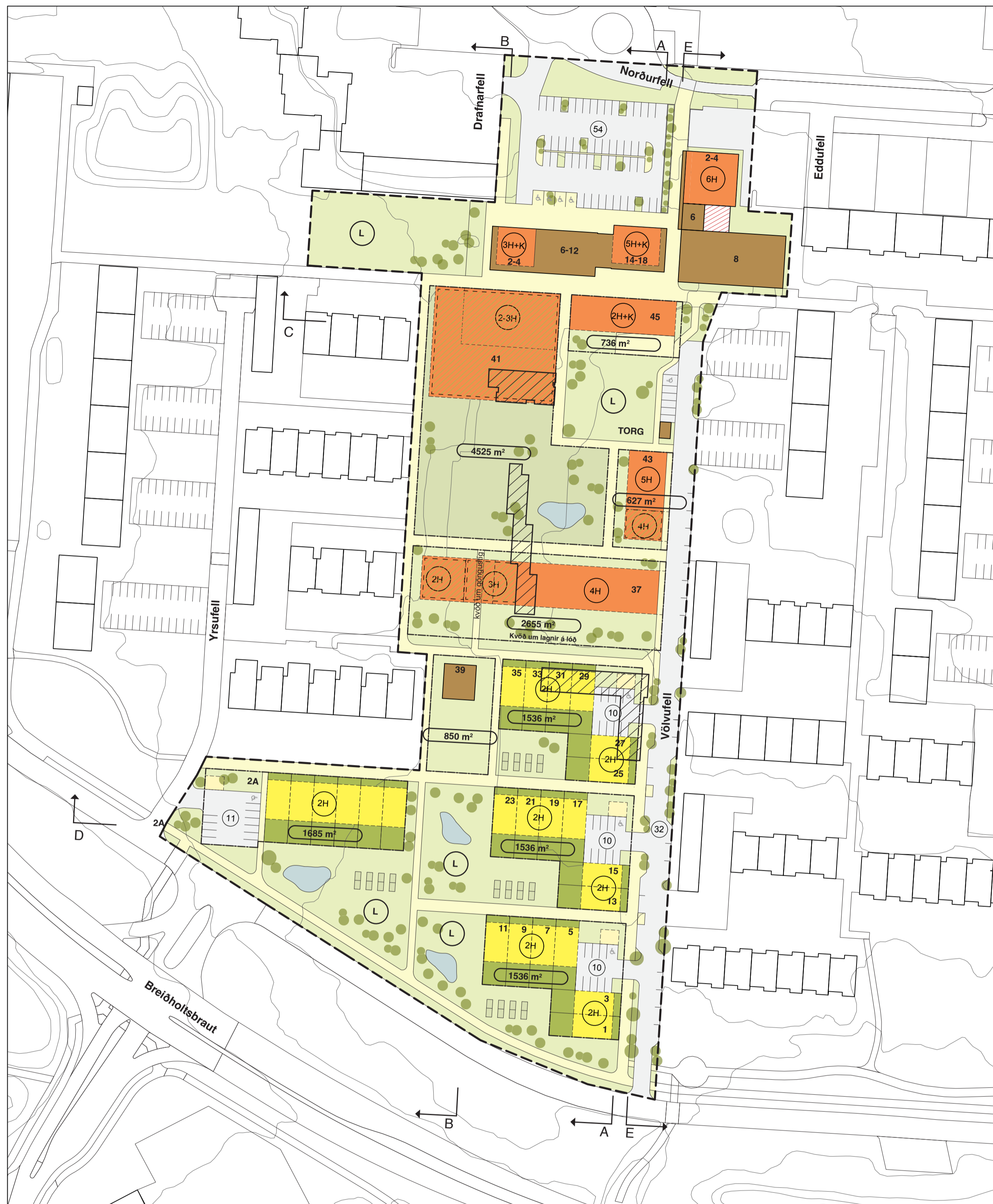
Deiliskipulag samþykkt 2. desember 2021 1:1000