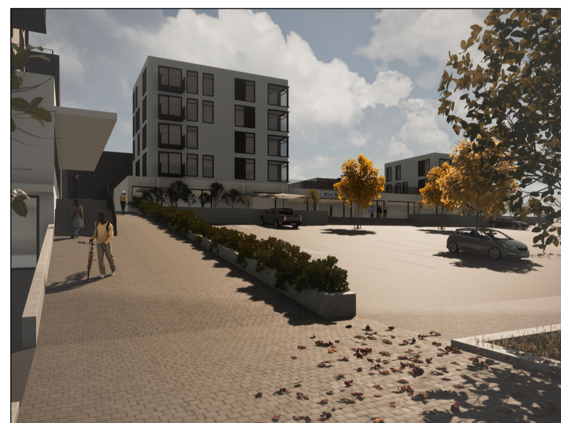
Perspektíf - horft til suðurs frá Eddufelli í átt að Drafnarfelli (Fellagarðar)