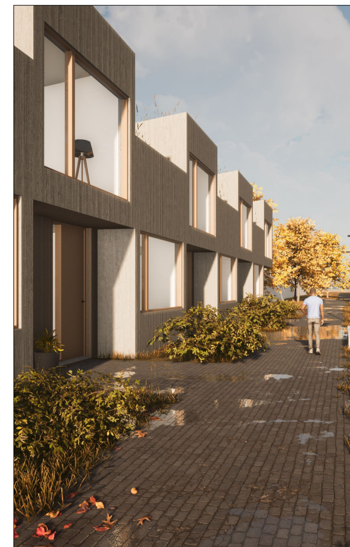
Perspektíf - horft til vesturs eftir Völvufelli 31-41