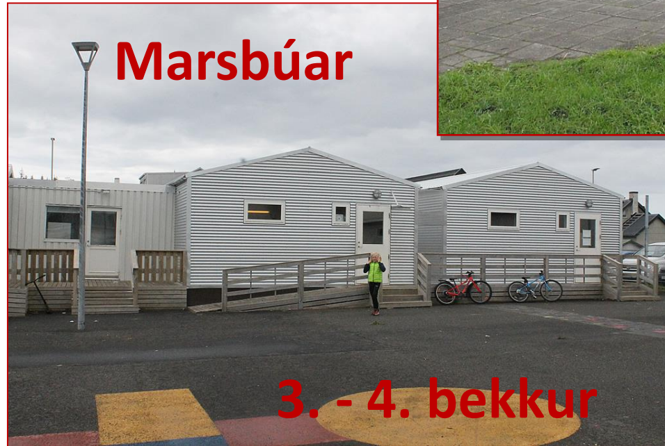
3. - 4. bekkur