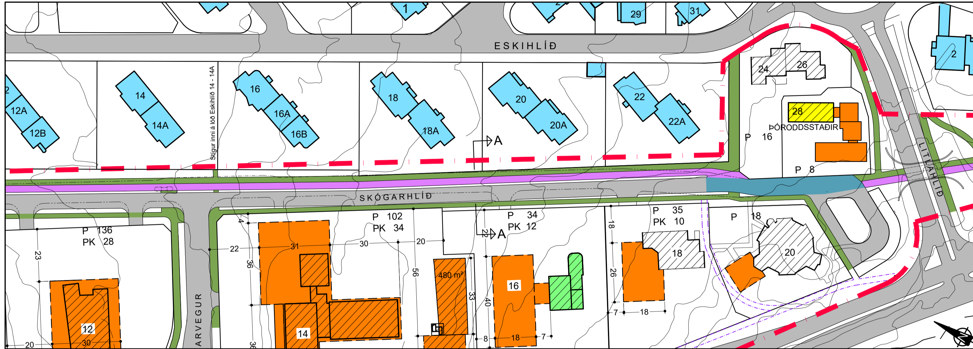
Deiliskipulaga Skógarhlíðar fyrir breytingu, samþykkt 06.02.2020 - M 1:1000