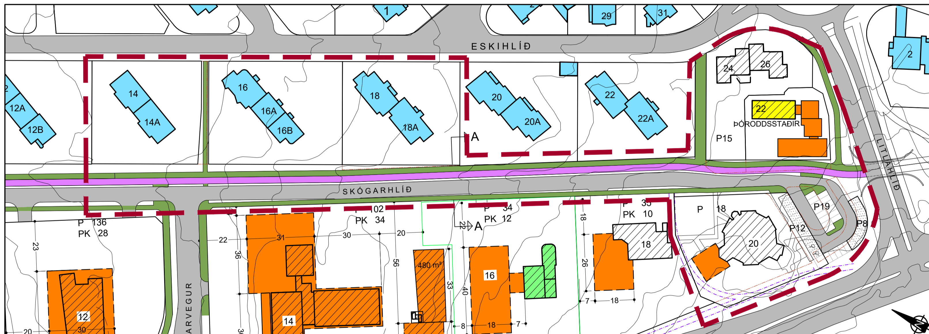
Deiliskipulaga Skógarhlíðar eftir breytingu - M 1:1000