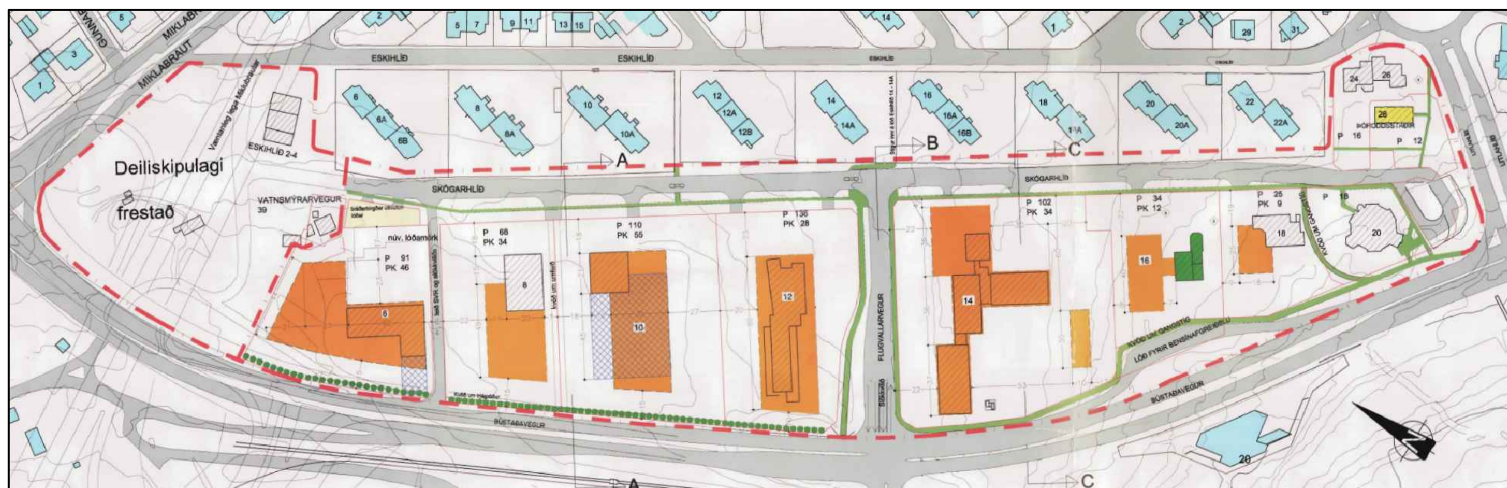
Upprunalegt deiliskipulag - M 1:2000 Samþykkt í Borgarráði 10. apríl 2001