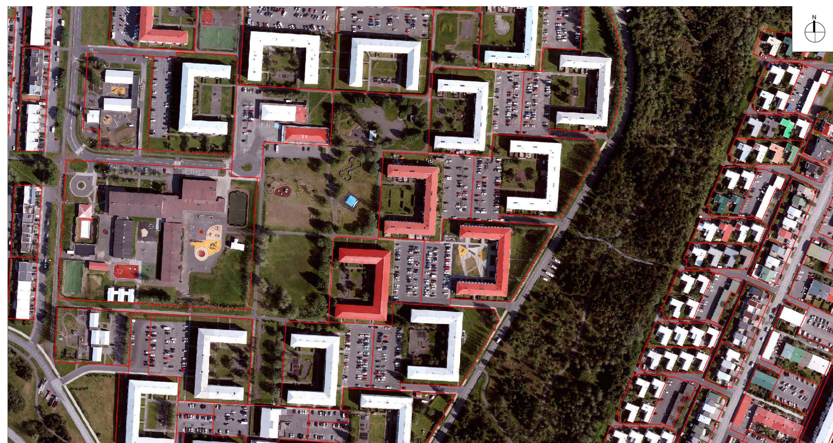
NÚVERANDI ÁSTAND - SKÝRINGARMYND

Breytingin felst í því að breyta skipulagsmörkum þróunarreits 6.1.6.Þ til þess að ná utan um leikskólalóð við Arnarbakka 4. Skilmálaeining 6.1.1.Þ mun minnka, þar sem grænt svæði sem tilheyrir skilmálaeiningunni verður fellt inn í þróunarreit 6.1.6.Þ. Eftir að uppbyggingu á svæðinu er lokið, samkvæmt nýju deiliskipulagi, er gert ráð fyrir að skipulagið verði fellt inn í hverfisSKIPULAG Neðra-Breiðholts og fá skilmálaeiningarnúmerið 6.1.6.