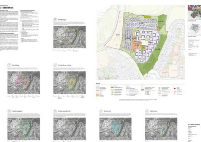
GILDANDI HVERFISSKIPULAG BREIÐHOLT/SELVAHVERFI