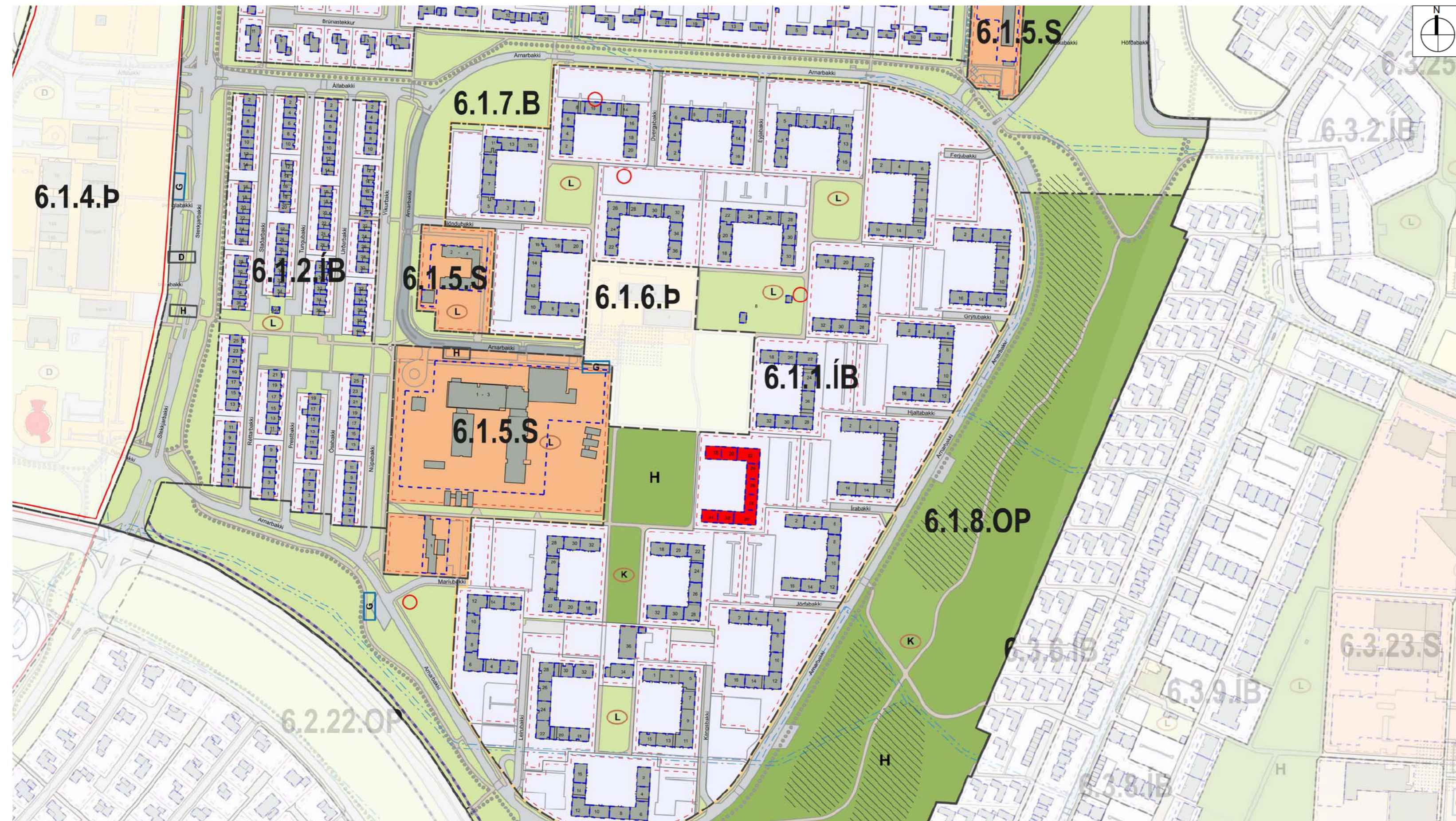
HLUTI AF GILDANDI HVERFISSKIPULAGI