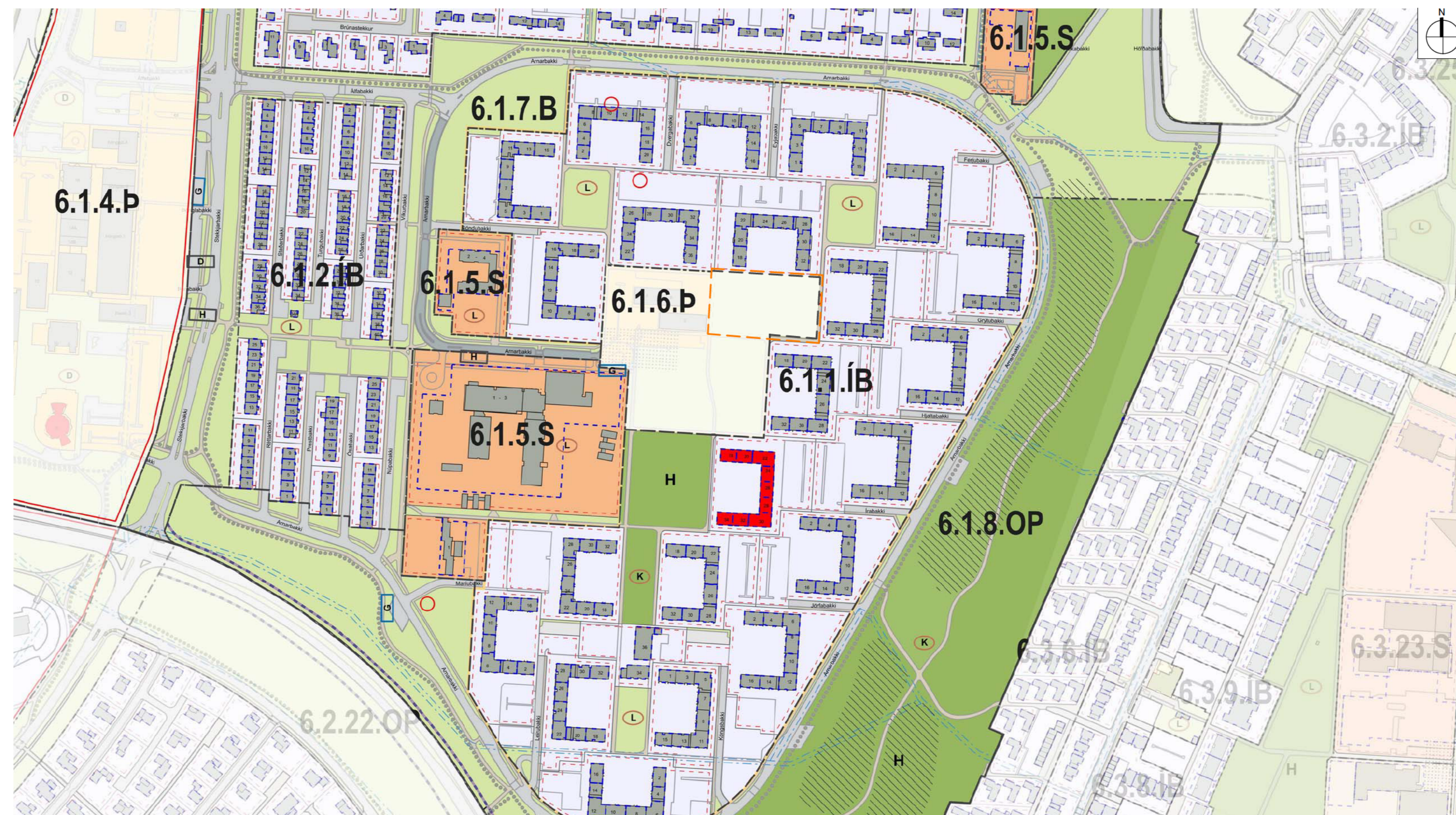
TILLAGA AÐ BREYTINGU Á HVERFISSKIPULAGI

Í gildi er "HverfisSKIPULAG Í Neðra Breiðholti" sem staðfest var 09.12.2021 og tók gildi 04.05.2022 með birtingu auglýsingar í B - deild Stjórnartíðinda. Sjá https://skipulag.reykjavik.is/hverfisSKIPULAG/breiðholt/