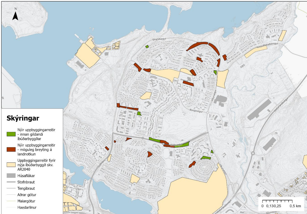
Mynd 5: Svæði sem mögulega taka breytingum í Grafarvogi skv. AR2040