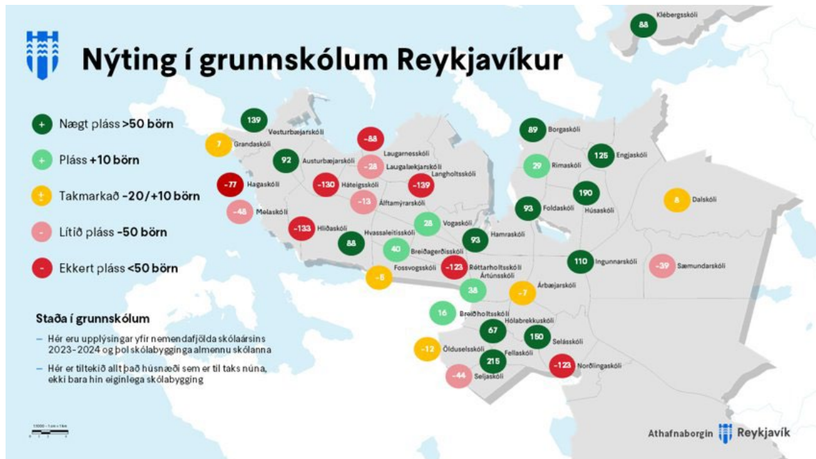
Mynd 4. Nýting í grunnskólum Reykjavíkur er stöðugum breytingum háð og mótast af mörgum utanaðkomandi þáttum, þ.e. ekki einvörðungu fjölda nemenda á grunnskólaaldri með lögheimili í viðkomandi skólahverfa. Meðal þess sem hefur áhrif á nýtingu skólabygginga eru viðhaldsverkefni, s.s. vegna myglu, sem geta kallað á að vannýttir skólar í einstökum hverfum eru nýttir til að mæta tímabundinni húsnæðisvandráðum í öðru skólahverfi. Myndin að ofan gefur þó til kynna að helst séu tækifæri til að fjölga nemendum í skólahverfum í Grafarvogi

Undanfarin ár hafa verið greindir möguleikar til minniháttar þéttingar innan gróinna íbúðarhverfa í vinnu við hverfisskipulag. Vinnan við hverfisskipulagið er umfangsmikil og hefur tekið lengri tíma en ætlað var en nú liggur fyrir samþykkt hverfisskipulag fyrir Árbæ, Breiðholt og hverfisskipulag Hlíða er í lokaafgreiðslu. Vinna við hverfisskipulagið er einnig langt komin í Háaleiti-Bústaði og ákveðin undirbúningsvinna hefur farið fram í öðrum borgarhlutum. Það liggur þó fyrir að enn eru nokkur ár í að fullklára hverfisskipulag fyrir þá borgarhluta sem eftir standa. Í ljósi stöðunnar á húsnæðismarkaði og markmiða húsnæðisáttaksins (sjá kafla 1.1) var ákveðið að flýta því að greina möguleika á minniháttar íbúðarþéttingu innan valinna hverfa, sem annars hefði farið fram við undirbúning hverfisskipulags og fyrirséð að sú vinna hefjist ekki á næstu misserum í viðkomandi borgarhluta. Í ljósi markmiða húsnæðisáttaksins, að horfa til hverfa þar sem svigrúm er til fjölgunar nemenda í grunnskólum, var ákveðið að setja greiningu í Grafarvogi í forgang (sjá nánar kafla 4.2). Í undirbúningi þeirrar vinnu hafa verið mótuð almenn viðmið sem verði horft til við greiningu á uppbyggingarmöguleikum innan gróinna byggða í öðrum borgarhlutum eftir því sem við á, sbr. einnig áherslur við gerð hverfisskipulagsins.