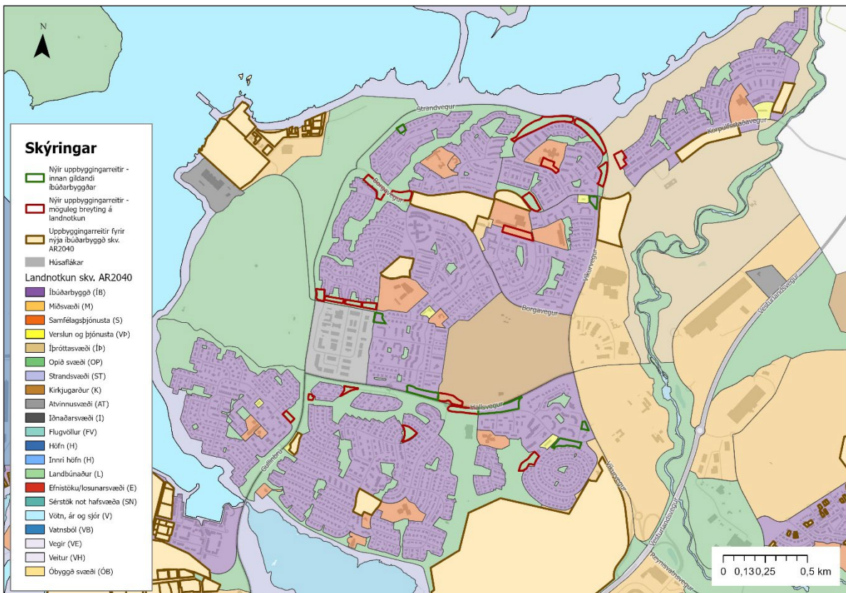
Mynd 6: Svæði og reitir sem hafa verið til skoðunar í samhengi við skilgreind landnotkun skv. AR2040