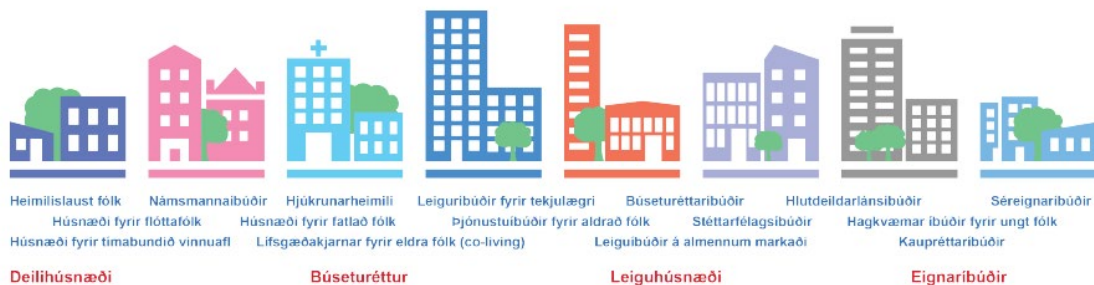
Mynd 1. Fjölbreytt framboð búsetukosta fyrir alla félagshópa er megin markmið í Húsnæðisáætlun 2024-2033

Í upphafi árs 2023 var gerður Húsnæðissáttmáli milli Reykjavíkurborgar, Húsnæðis- og mannvirkjastofnunar og Innviðaráðuneytisins, sem boðaði uppbyggingu allt að 16 þúsund íbúða á næstu 10 árum, með áherslu á kröftugri uppbyggingu á fyrri hluta tímabilsins eða á meðan verið er að mæta uppsafnaðri þörf og skapa jafnvægi á húsnæðismarkaði. Sáttmálinn boðaði kröftugri vöxt en langtímaviðmið Aðalskipulags Reykjavíkur (AR2040) sögðu til um. Þessi markmið sáttmálans voru tekin upp í uppfærðri Húsnæðisáætlun Reykjavíkur 2024-2033, sem samþykkt var í desember 2024. Ljóst er að áskorun er að ná hinum háleitu markmiðum um fjölgun íbúða til skemmri tíma litið, í ljósi núverandi stöðu á lána- og byggingarmarkaði og því brýnt að finna nýjar leiðir til að stuðla að aukinni uppbyggingu. Verklýsing þeirrar aðalskipulagsbreytingar sem hér er lögð fram er liður í því að skapa jarðveg fyrir skilvirkari og hraðari uppbyggingu þegar byggingarmarkaðurinn tekur aftur við sér.