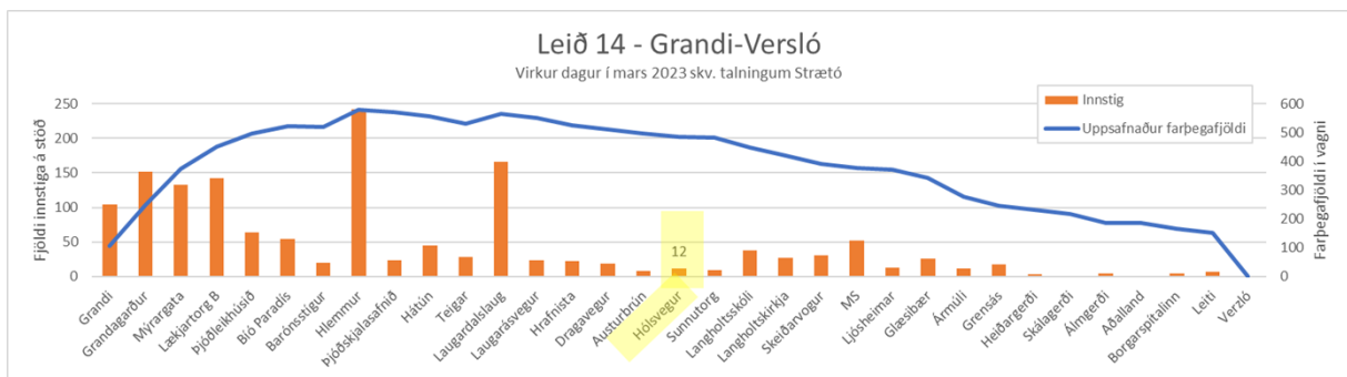
Mynd 2 Talningar Strætó fyrir leið 14 Grandi-Versló á virkum degi í mars 2023 þar sem sjá má fjölda innstiga á Hólsvegi

Virðingarfyllt, Grétar Mar Hreggviðsson Umhverfis- og skipulagssvið