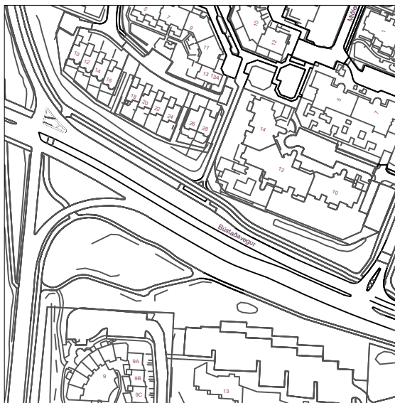
Skýringarmynd fyrir breytingu á deiliskipulagi (MKV. 1:2500)