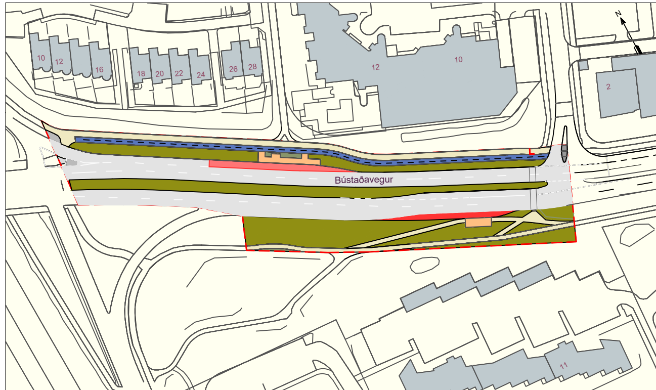
Skipulagsuppdráttur (MKV. 1:1250)

Hæðarblað skal sýna kóta og hæðir framkvæmdar og mæliblöð skulu sýna stærðir og kvaðir ef einhverjar eru o.fl.