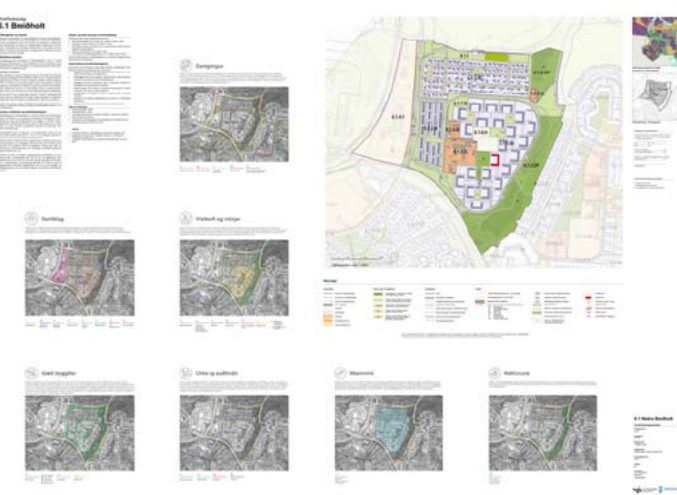
GILDANDI HVERFISSKIPULAG BREIÐHOLT/SELVAHVERFI

Hverfisgjörnbreyting þessi sem fengið hefur meðferð í samræmi við ákvæði 5. mgr. 37. gr. sbr. 1. mgr. 43. gr. skipulagslaga nr. 123/2010 var samþykkt