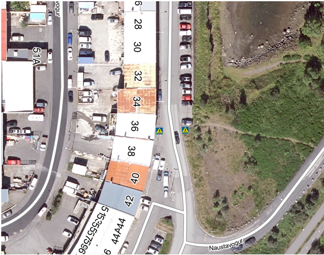
2. Yfirlitsmynd með fyrirhugaðri gangbraut merktri