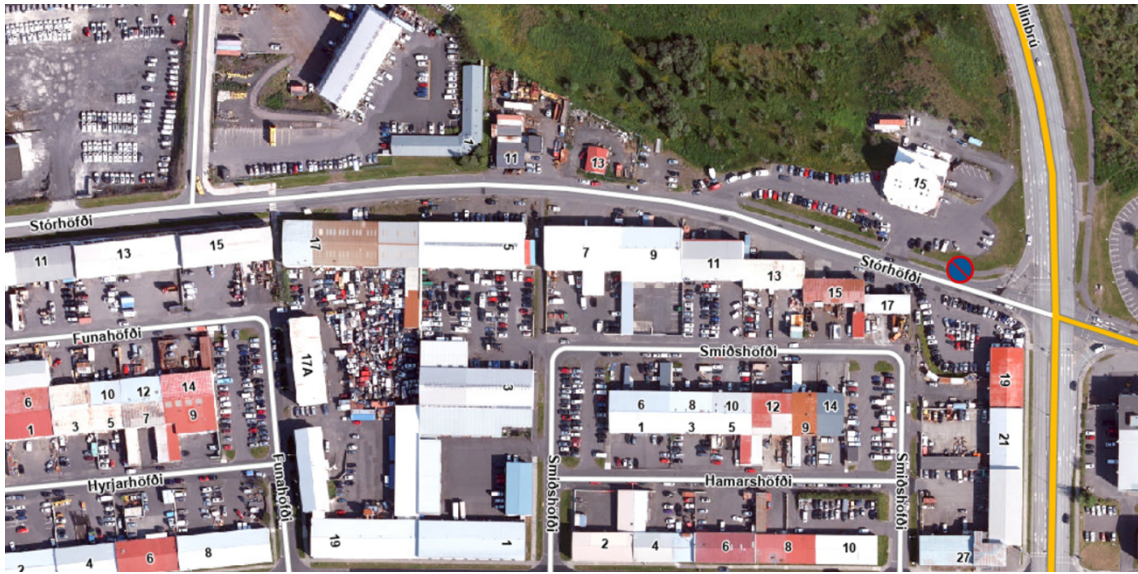
Yfirlitsmynd með tillögu að umferðarmerkjum.