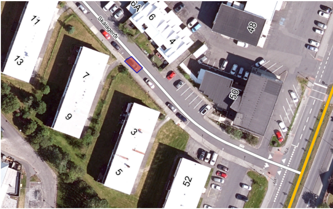
Tillaga að staðsetningu stæðisins. Nánari útfærsla fer eftir aðstæðum.