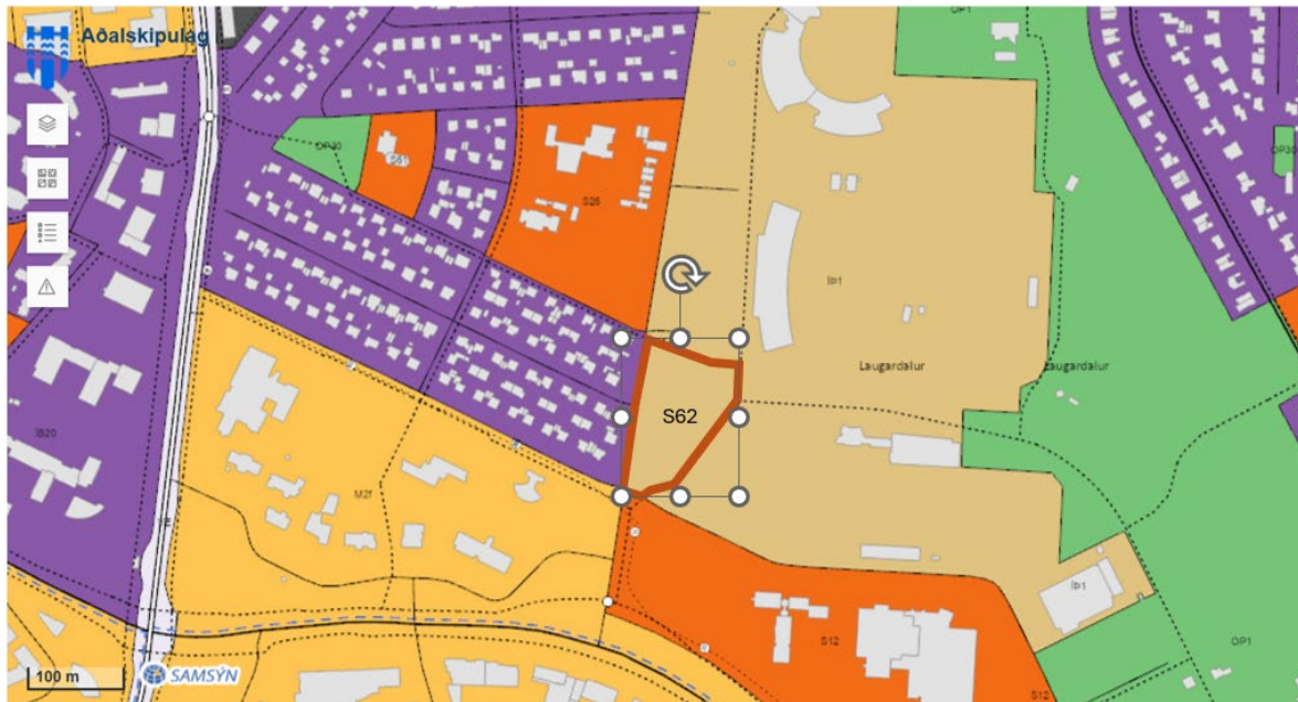
Mynd 2. Afmörkun svæðis við Reykjaveg sem mun taka breytingum og verða skilgreint sem svæði fyrir samfélagsþjónustu (S62). Hluti þéttbýlisuppdráttar aðalskipulags, sbr. framsetning í skipulagssjá.

Möguleg breytingartillaga felur það í sér að íþróttasvæði (ÍP1) í Laugardal verði minnkað sem nemur um 1,0 ha og verði skilgreint sem svæði fyrir samfélagsþjónustu (S62). Breytingin verður útfærð með formlegum hætti í endanlegri tillögu, sem breyting á þéttbýlisuppdrætti aðalskipulagsins.