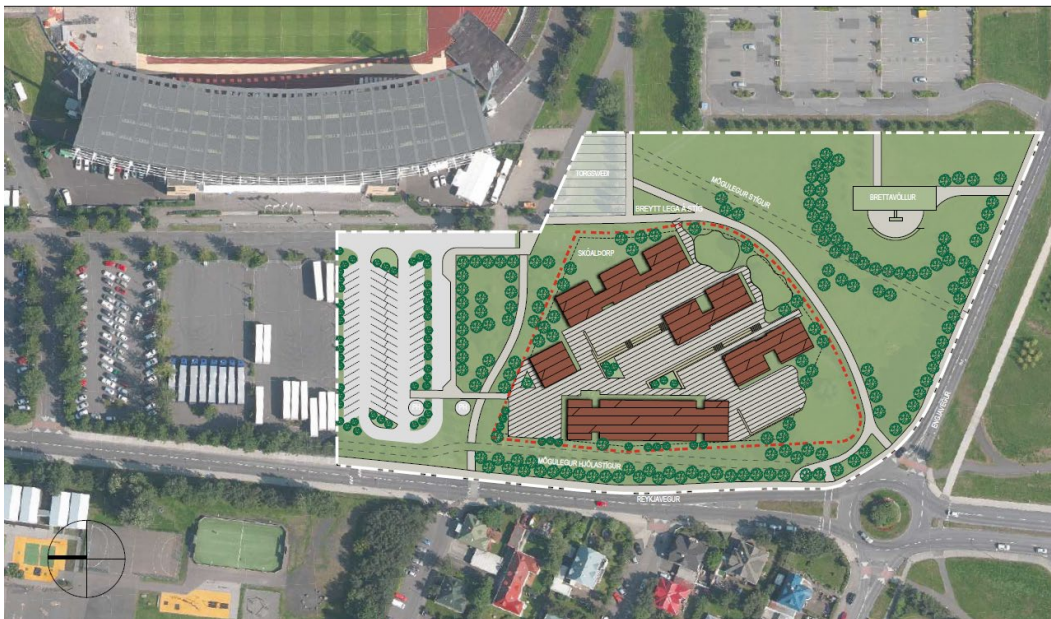
2. mynd. Skólaþorp við Reykjaveg, tímabundin húsnæðislausn til að mæta brýnni þörf vegna viðhaldsverkefna og fjölgunar nemanda.

Megin tilgangur breytingar er að skapa skilyrði fyrir skjóta uppbyggingu skólastofnana til að mæta brýnni þörf sem nú er til staðar í viðkomandi grunnskólahverfum. Um er að ræða tímabundnar lausnir, bæði til að mæta ástandi vegna viðhaldsþarfar í núverandi skólahúsnæði í hverfinu og vegna fjölgunar nemenda undanfarin ár. Um meiriháttar viðhaldsverkefni er að ræða sem varðar bæði skóla- og frístundahúsnæði og því óhjákvæmilegt að ráðast í nokkuð stórtæka en tímabundna lausn með þróun skólaþorps á umræddu svæði við Reykjaveg (sjá hugmynd að útfærslu á 2. mynd). Gert er ráð fyrir að losa alla starfsemi úr húsnæði Laugarnesskóla, meðan á framkvæmdum stendur þar, og koma henni fyrir í skólaþorpinu, auk þess sem fengin verður aðstaða í núverandi byggingum KSÍ í grenndinni. Fyrir utan Laugarnesskóla er einnig veruleg viðhaldsþörf í Langholts- og Laugalækjarskólum. Það er því reiknað með því að þessi þrjár skólar þurfa að nýta aðstöðuna í skólaþorpinu á komandi árum. Það er því líklegt að skólaþorpið muni verða starfrækt í allmörg ár eða 5 til 10 ár.