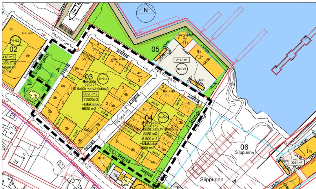
BREYTT DEILISKIPULAG FYRIR VESTURBUGT, REITIR 03 OG 04

Gildandi deiliskipulag fyrir lóðina er fylgiskjal með skilmálum þessum.