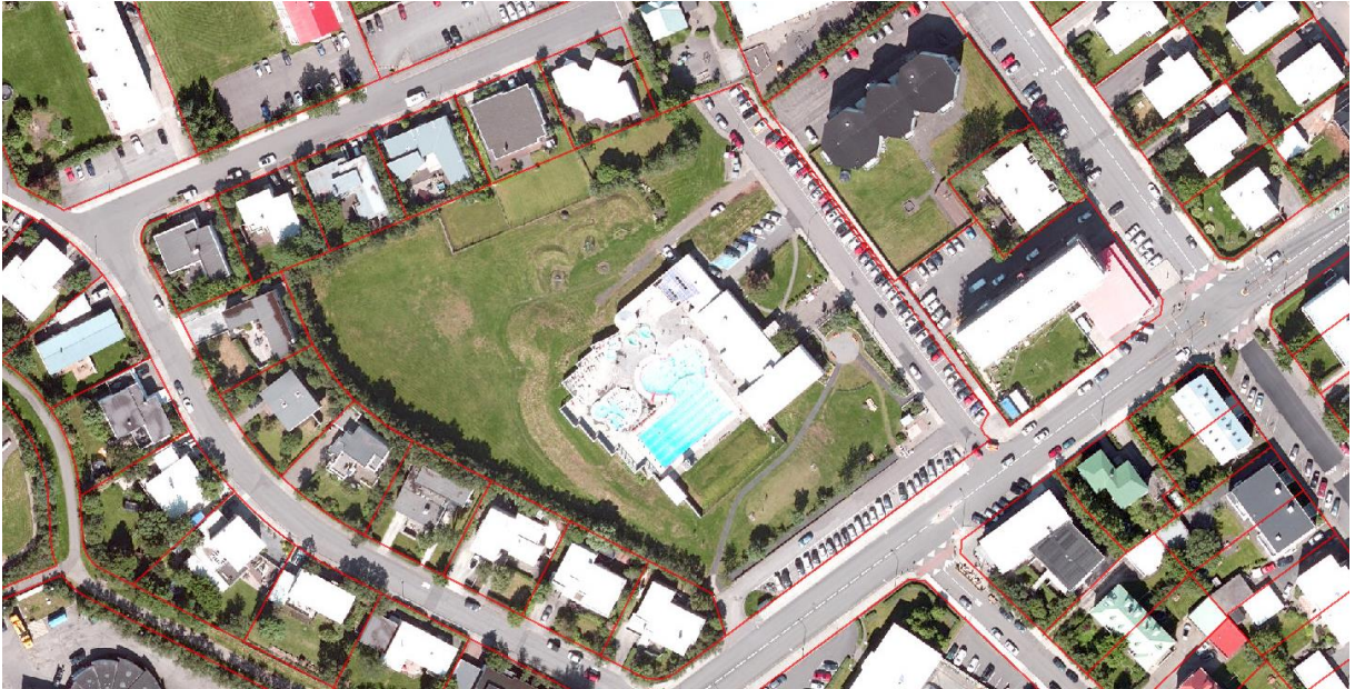
Loftmynd af svæðin, tekin árið 2018