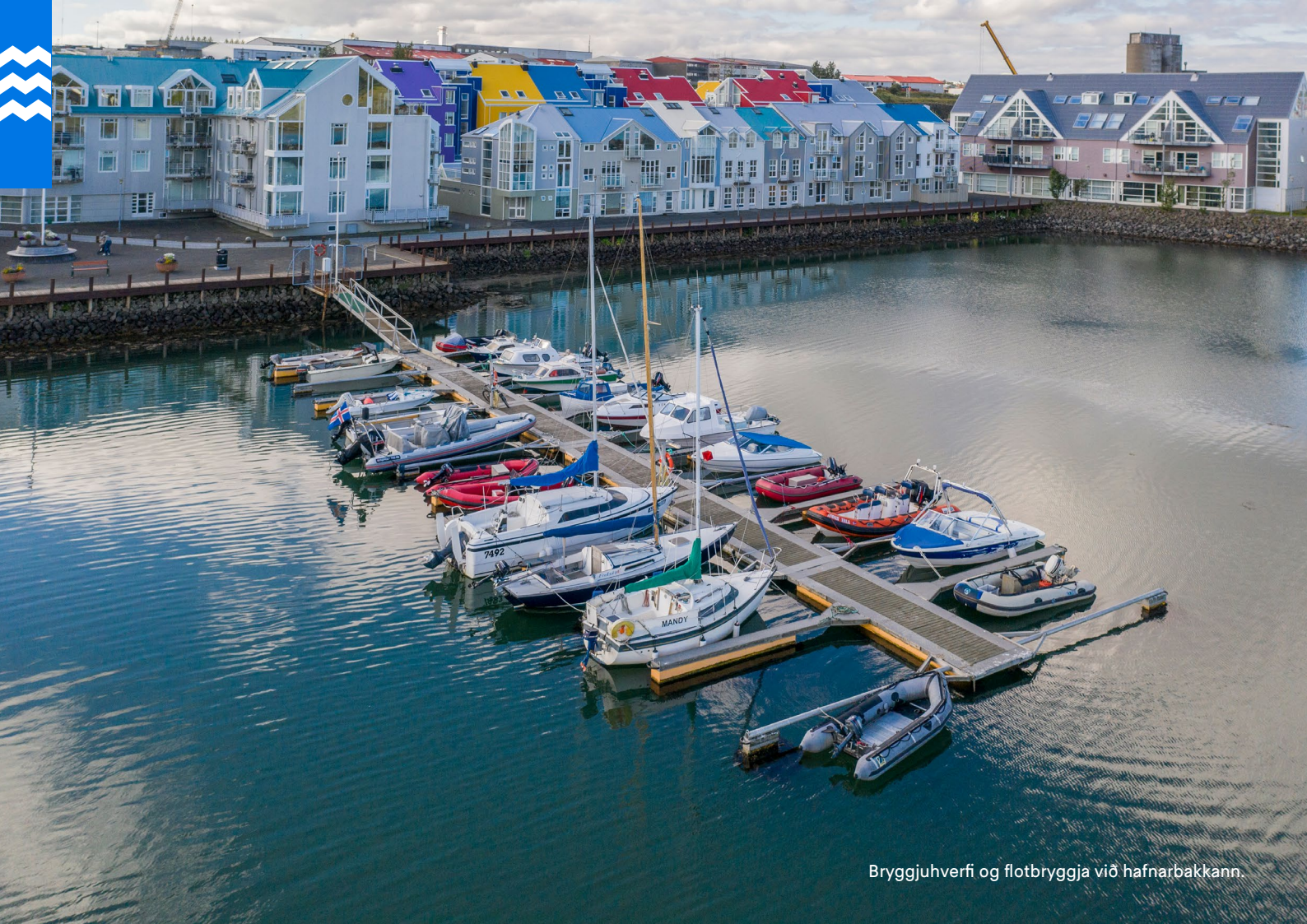
Bryggjuhverfi og flotbryggja við hafnarbakkann.