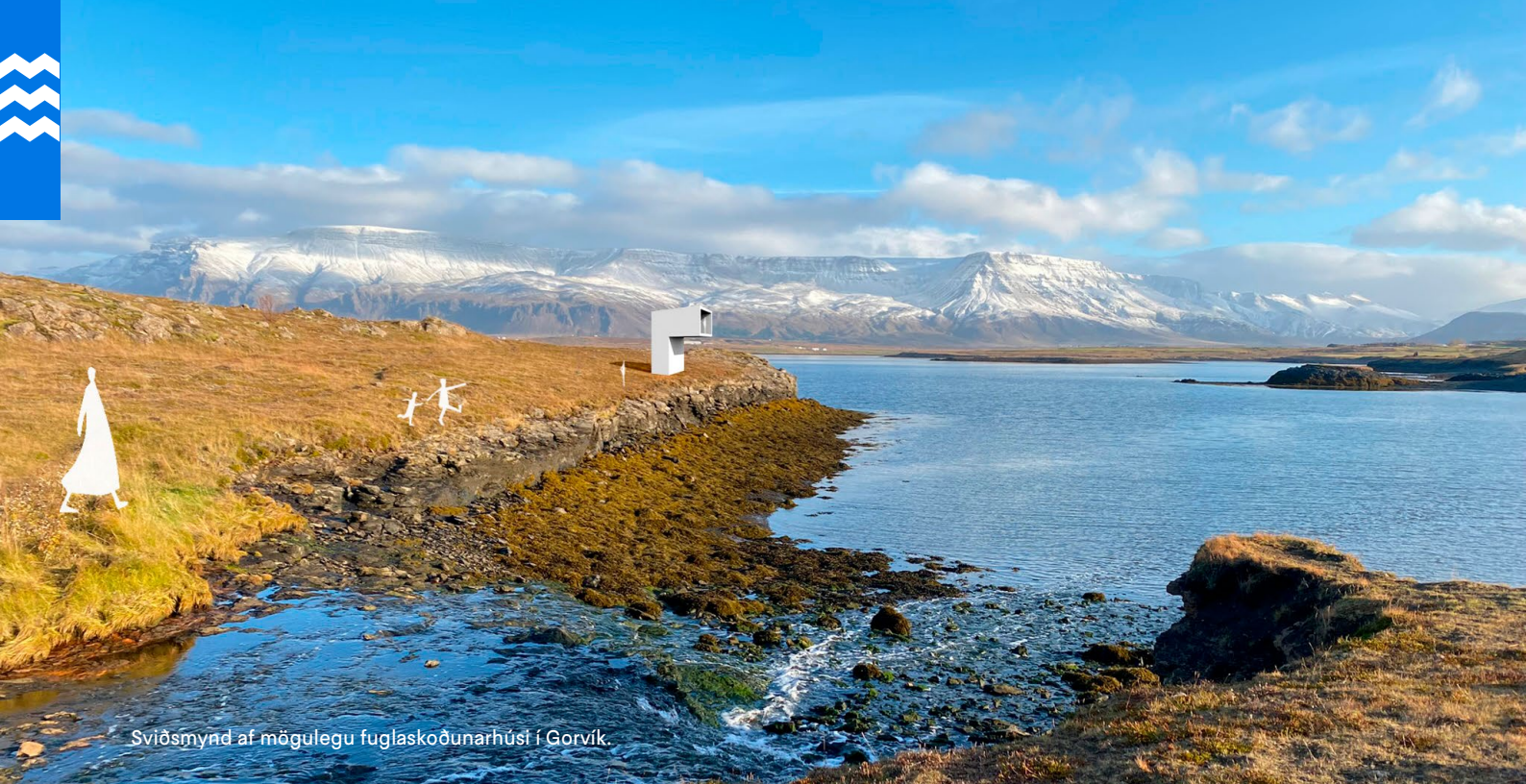
Sviðsmynd af mögulegu fuglaskoðunarhúsi í Gorvík.