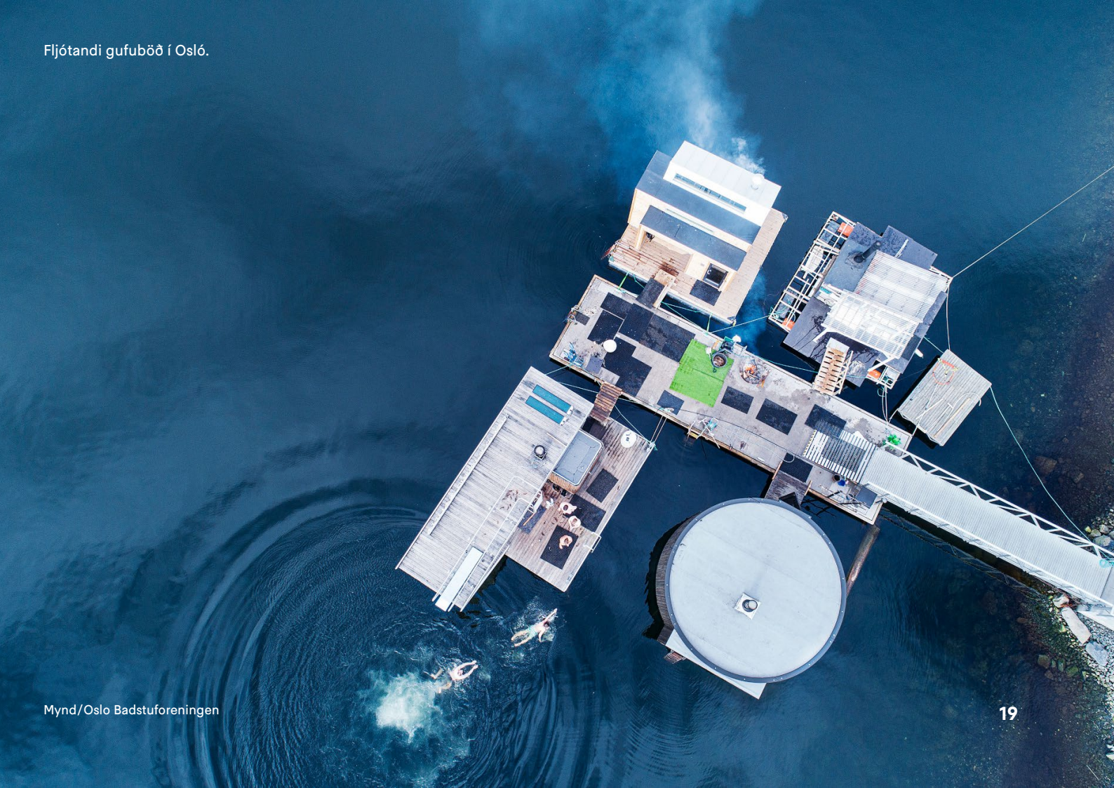
Fljótandi gufuböð í Osló.