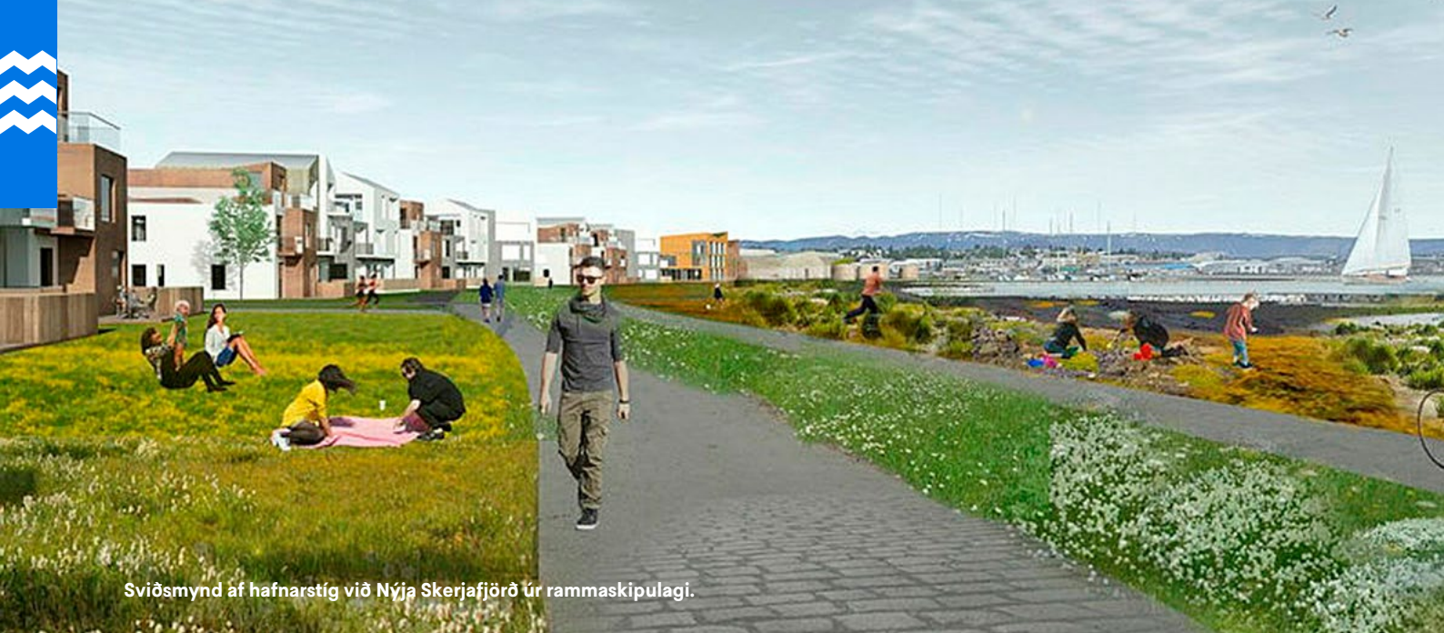
Sviðsmynd af hafnarstíg við Nýja Skerjafjörð úr rammaskipulagi.