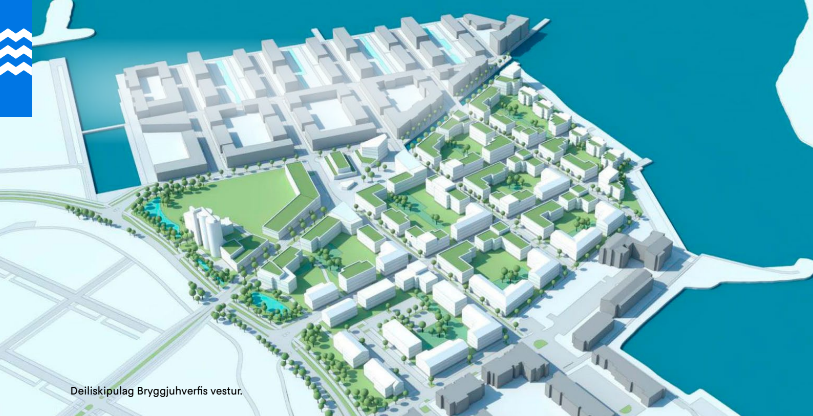
Deiliskipulag Bryggjuhverfis vestur.