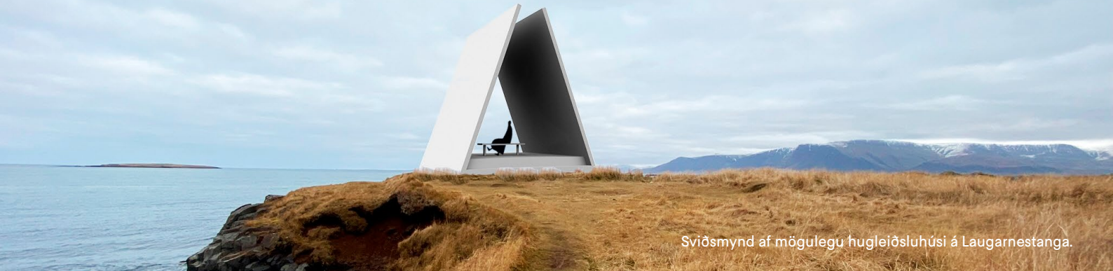
Sviðsmynd af mögulegu hugleiðsluhúsi á Laugarnestanga.