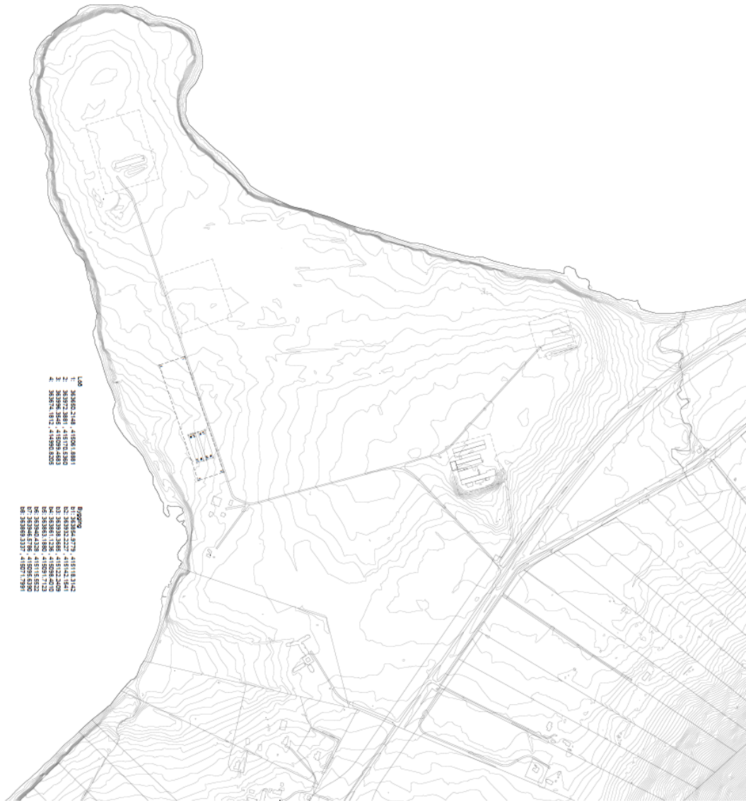
Mynd sýnir hnitsetta teikningu af jörðinni Saltvík.