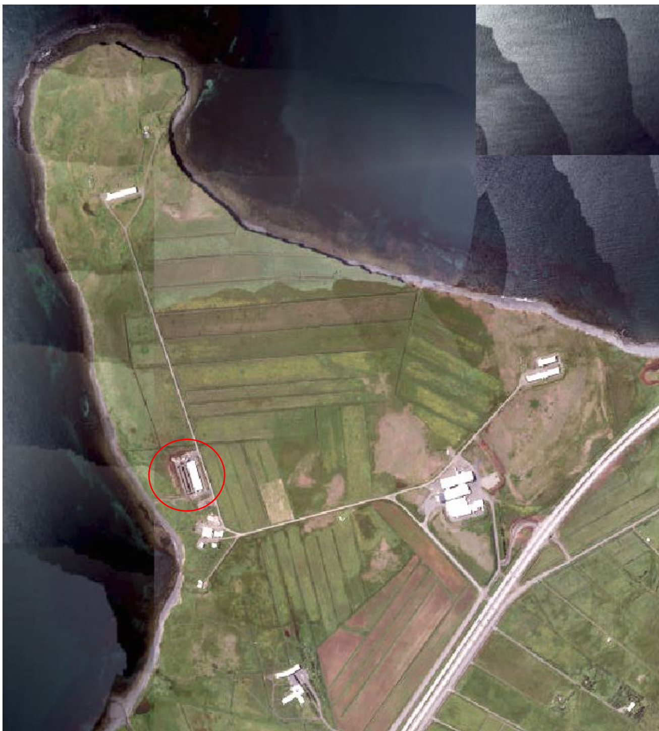
Loftmynd af jörðinni Saltvík úr Borgarvefsjá. Dreginn er rauður hringur kringum byggingar sem um ræðir á Reit C.