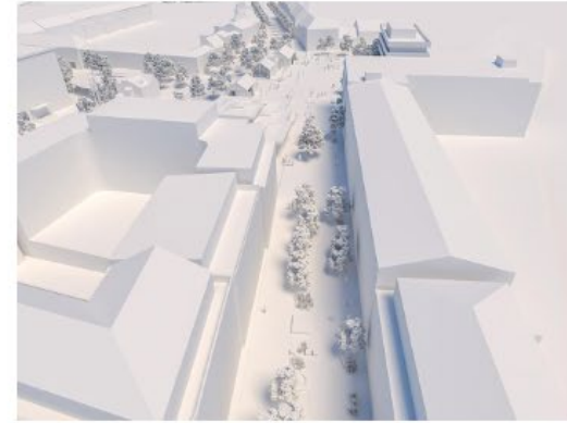
Laugavegur að Hlemmi.