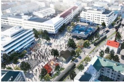
Hlemmsvæðið til framtíðar.