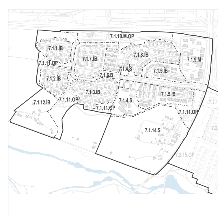
Skilmálaeiningar - skýringarmynd

Samþykktar- og staðfestingartími Hverfisskiptulag þetta sem fengið hefur meðhöndlingu samráði við ákvaða 5. mgr. 37. st. st. 1. mgr. 41. gr. skipulagslaga nr. 123 / 2010 var samþykkt á þann _____ 20____ og í þann _____ 20____ Tilgangur var auglýst frá _____ 20____ með athugasemdfrest til _____ 20____