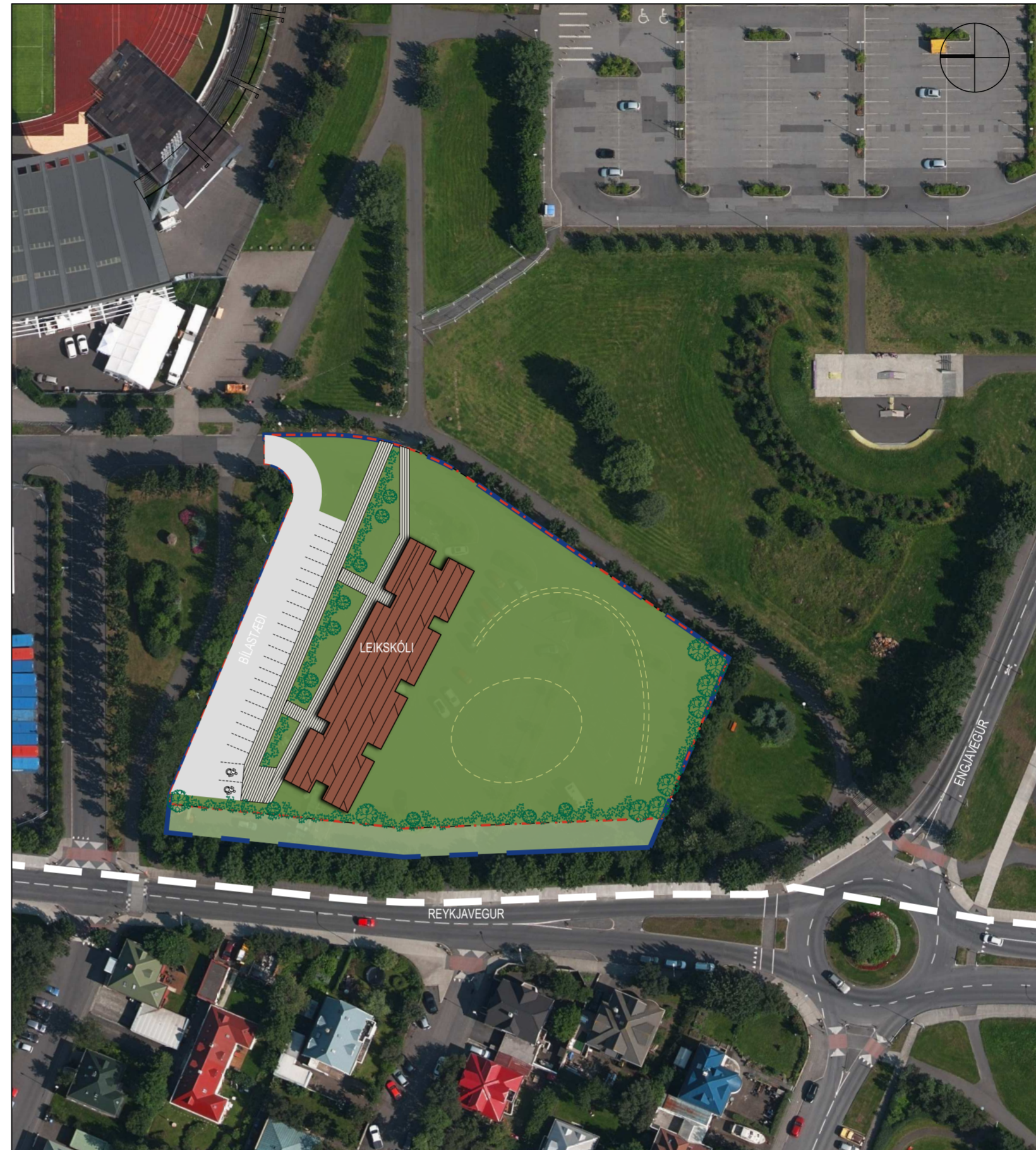
Breytt deiliskipulag - Skýringarmynd 1:1000 - Möguleg útfærsla