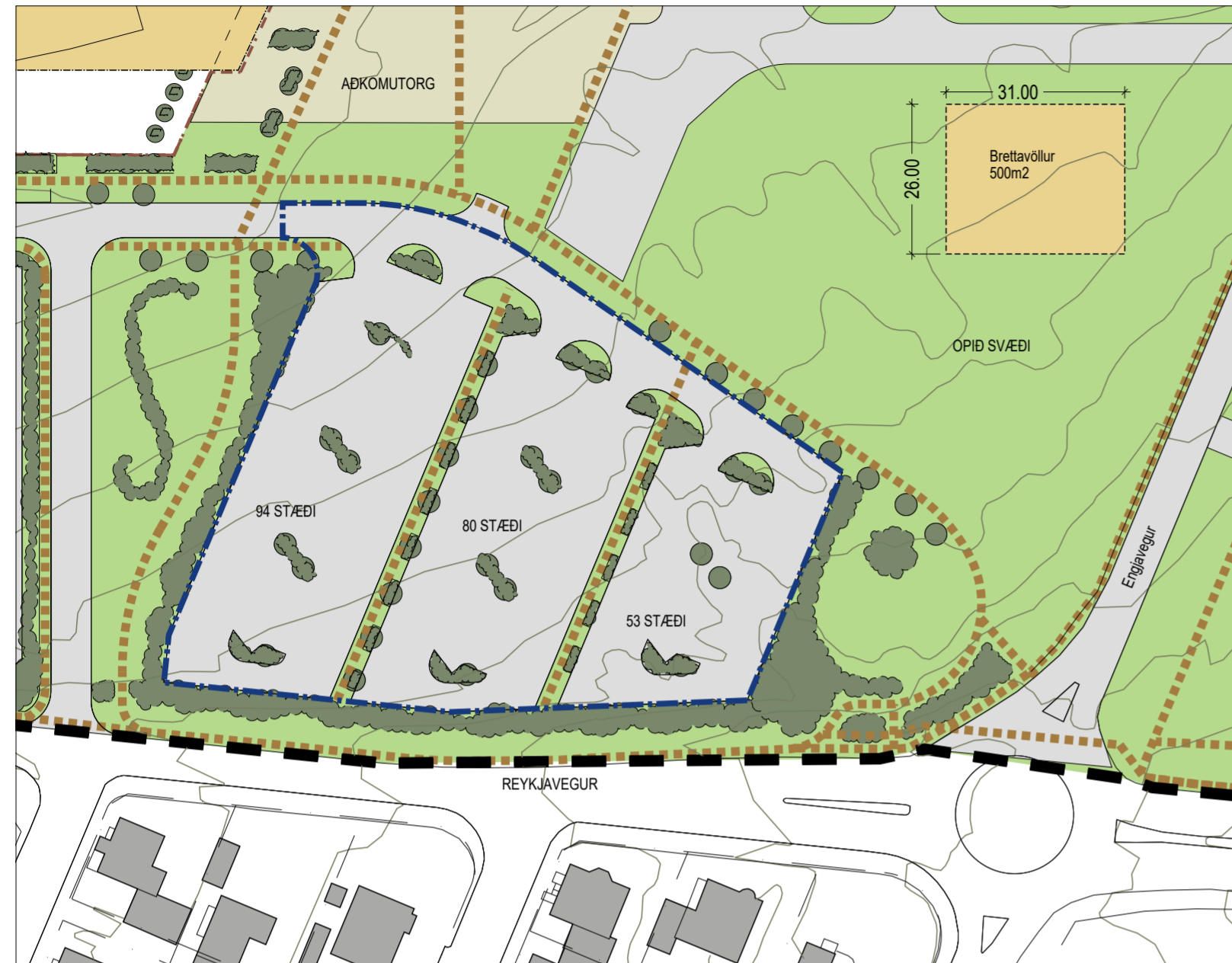
Gildandi deiliskipulag 1:1000