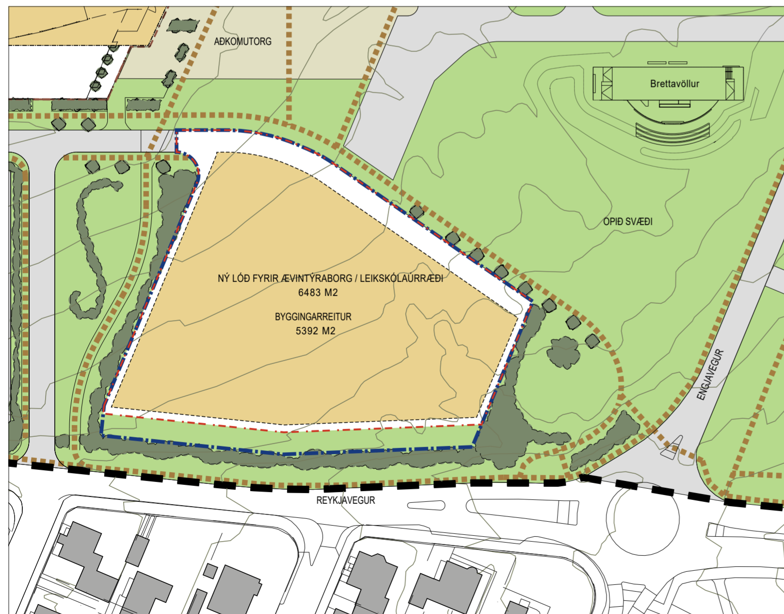
Breytt deiliskipulag 1:1000