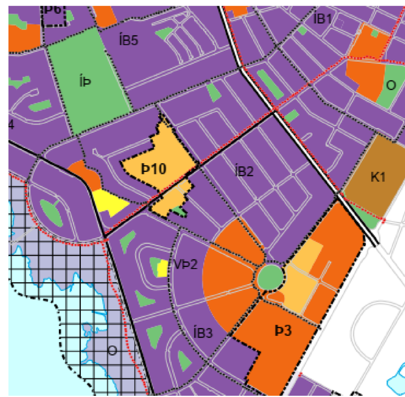
Hluti af aðalskipulagi Reykjavíkur 2010-2030.

Gerð er breyting á deiliskipulagi Vesturbæjarlaugar þar sem heimilað er stækkun lóða nr. 18-26 við Einimel með því að færa lóðarmörk út um allt að 3,1 metra. Samhliða verður girðing sem stendur lengra inn á borgarlandið fjarlægð og eru lóðarhafar sem það varðar og Reykjavíkurborg sammála um þá niðurstöðu og mun Reykjavíkurborg taka girðinguna niður. Lóðarhöfum er á eigin kostnað heimilt að setja upp nýja girðingu á lóðarmörkum eftir atvikum í samráði og samvinnu við borgina. Með þessari breytingu þá stækkar túnið (almenningsvæðið) umtalsvert miðað við það sem verið hefur síðustu áratugi. Stærðarbreyting lóða kemur fram á skýringarupprætti. Jafnframt er heimilað að stækka lóð nr. 26 lítillaga út til norðurs í átt að gangstétt í borgarlandi, nánari afmörkun þess verður ákveðið við gerð uppfærðs lóðarblaðs. Núverandi girðing þar mun standa óhreyfð þangað til annað verður ákveðið. Uppfæra þarf lóðarblöð til samræmis við breytt deiliskipulag.