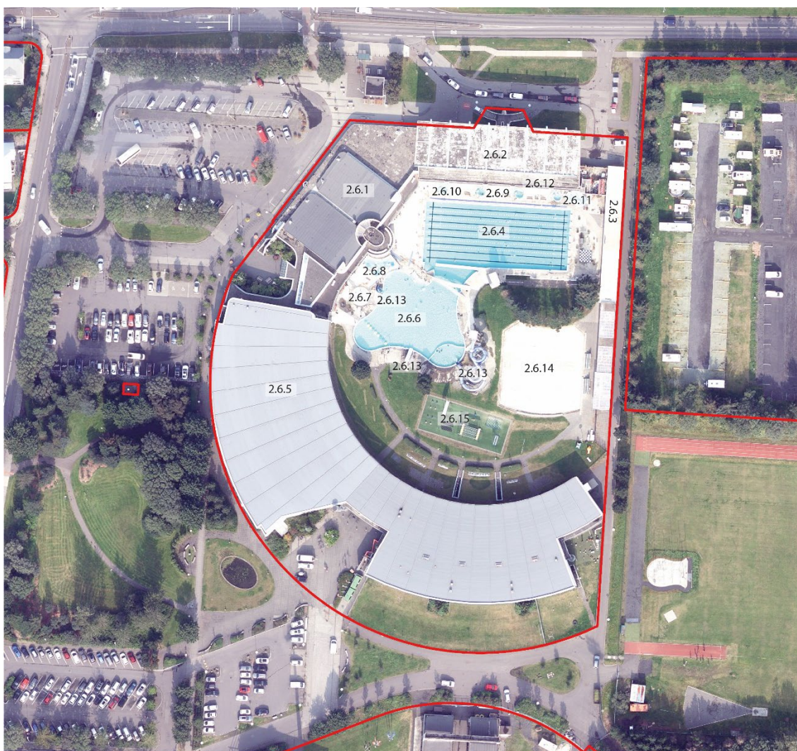
Loftmynd með kaflanúmerum til skýringar.