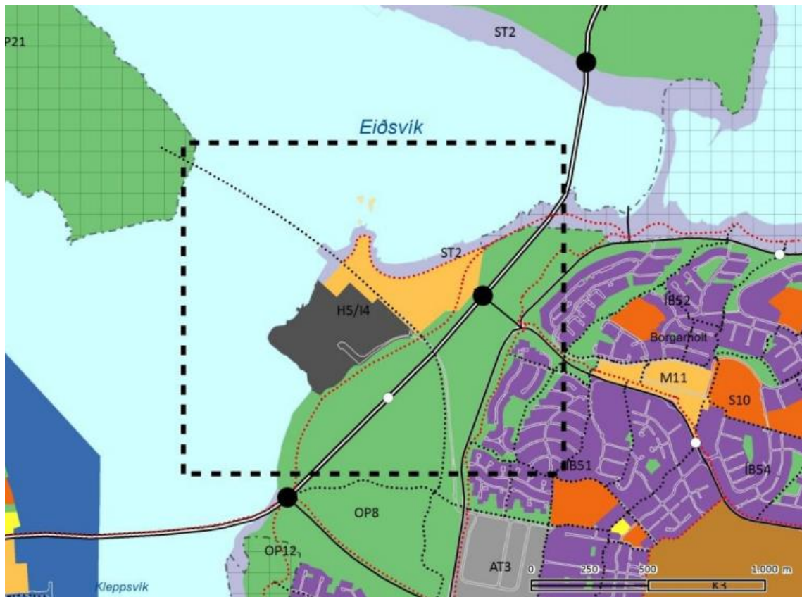
Mynd 5. Landnotkun á Gufunessvæðinu skv. Aðalskipulagi Reykjavíkur 2010-2030. Uppbyggingarsvæðið í Gufunesi 1.áfangi er merkt með gulum lit, miðsvæði.

Norðaustan þess og norðan er Eiðsvík og Geldinganes og að sunnan Grafarvogurinn. Frístundamiðstöðin Gufunesbær var stofnuð haustið 1998 og sér Íþrótt- og tómstundaráð Reykjavíkur um hana.