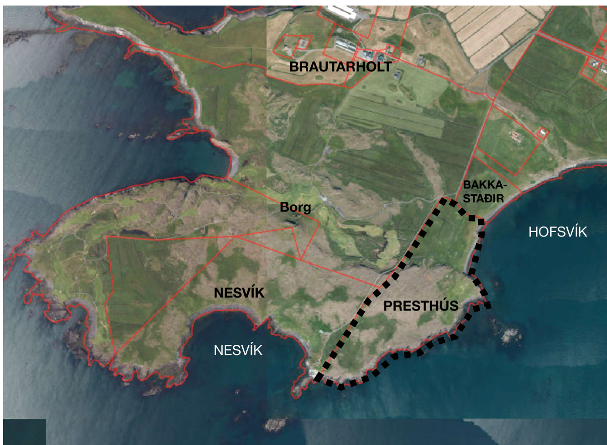
MYND 1. Myndin sýnir staðsetningu skipulagssvæðisins, sem nær til allrar jarðar Presthúsa.

Deiliskipulagssvæðið er afmarkað á mynd 1 með brotalínu. Aðkoma að svæðinu verður um núverandi vegstæði. Norðurhluti landsins eru framræst tún sem komin eru í órækt. Um landið mitt liggur klettóttur hæðarhryggur. Suður af klettabeltinu er landið óræktað og hallar til suðurs niður í fjöru. Gróðufar er fjölbreytt, allt frá grasi vöxnum brekkum og mýrum í malarhryggi og grýtt holt. Sandfjara er við Hofsvík en suðurströndin er stórgrýtt. Eitt mannvirki er á svæðinu, það er löngu aflagður sumarbústaður sem er að hruni kominn.