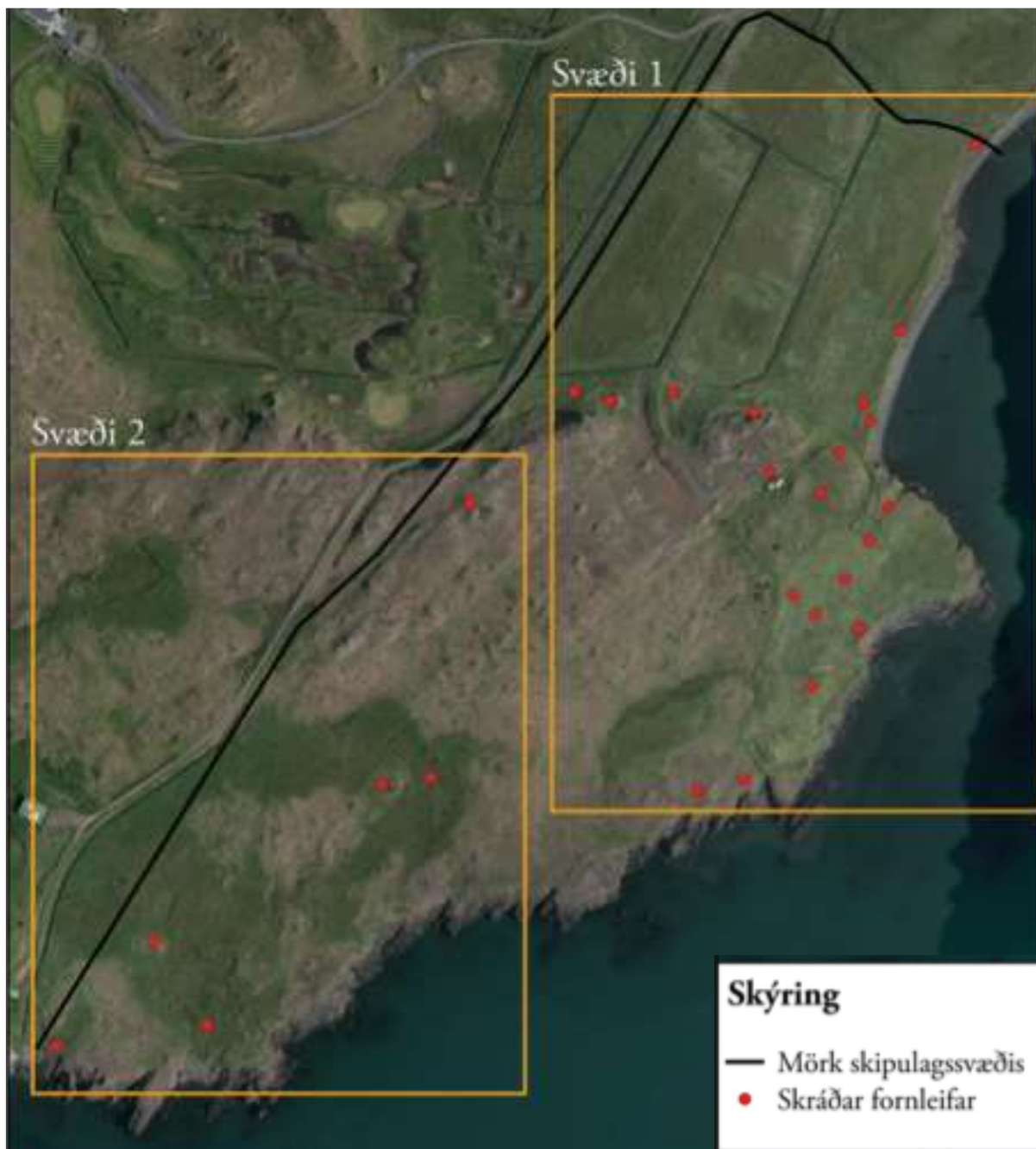
MYND 4. Myndin sýnir staðsetningu þekktra fornleifa í Presthúsum, merktar með rauðum hringjum. Svört lína sýnir jarðamörk.

Nokkrar fornleifar eru á jörðinni Presthús skv. skráningu fornleifa sem unnin var 2019 af Fornleifastofnun Íslands; Prestvík á Kjalarnesi, Deiliskráning vegna hugmynda um uppbyggingu . Búsetuminjar eru að miklu leyti innan 50 metra friðlínu við ströndina ásamt því að vera í nálægð við gamla bæjarstæðið. Framkvæmdir miðast við að hrófla sem minnst við minjum á svæðinu.