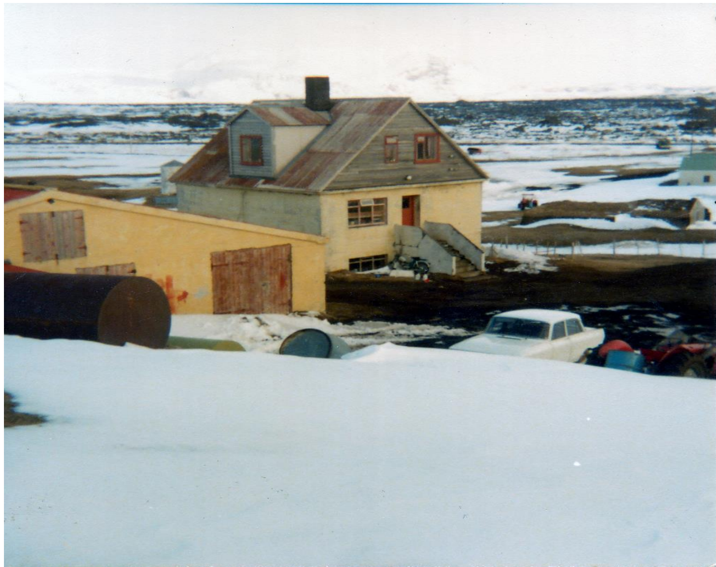
Bærinn heima í Garði, líklega í maí 1979. Rishæðin ofan á húsinu var byggð þegar ég var á níunda árinu, þá fengum við systurnar sérherbergi sem við kölluðum svo þótt að sjálfsgöðu værum við þar tvær saman. En miðað við herbergið í kjallaranum þar sem fjölskyldan hafði búið öll var þetta hreinn lúxus!