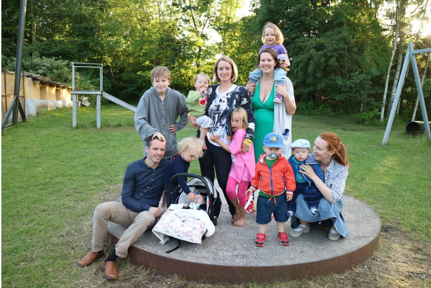
Börn og barnabörn 2016