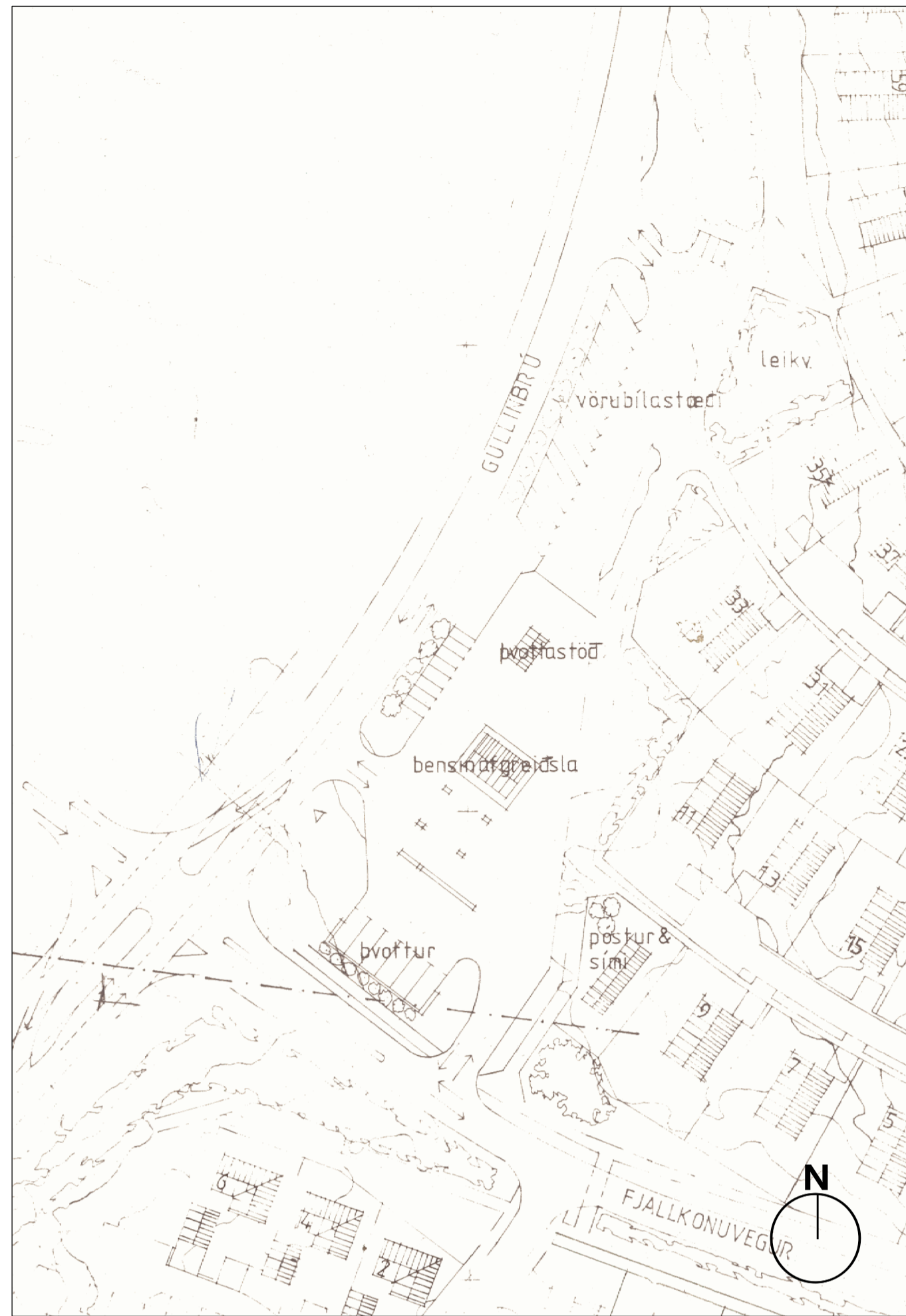
Gildandi deiliskipulag "Foldahverfi neðri hluti" mkv. 1:1000 Samþykkt í borgarráði 19.11.1984

Lóð Verslunar og þjónustulóð Landnúmer L110068 Staðgreinir 0-1- 2855301 Lóðarstærð 4661,0 m 2