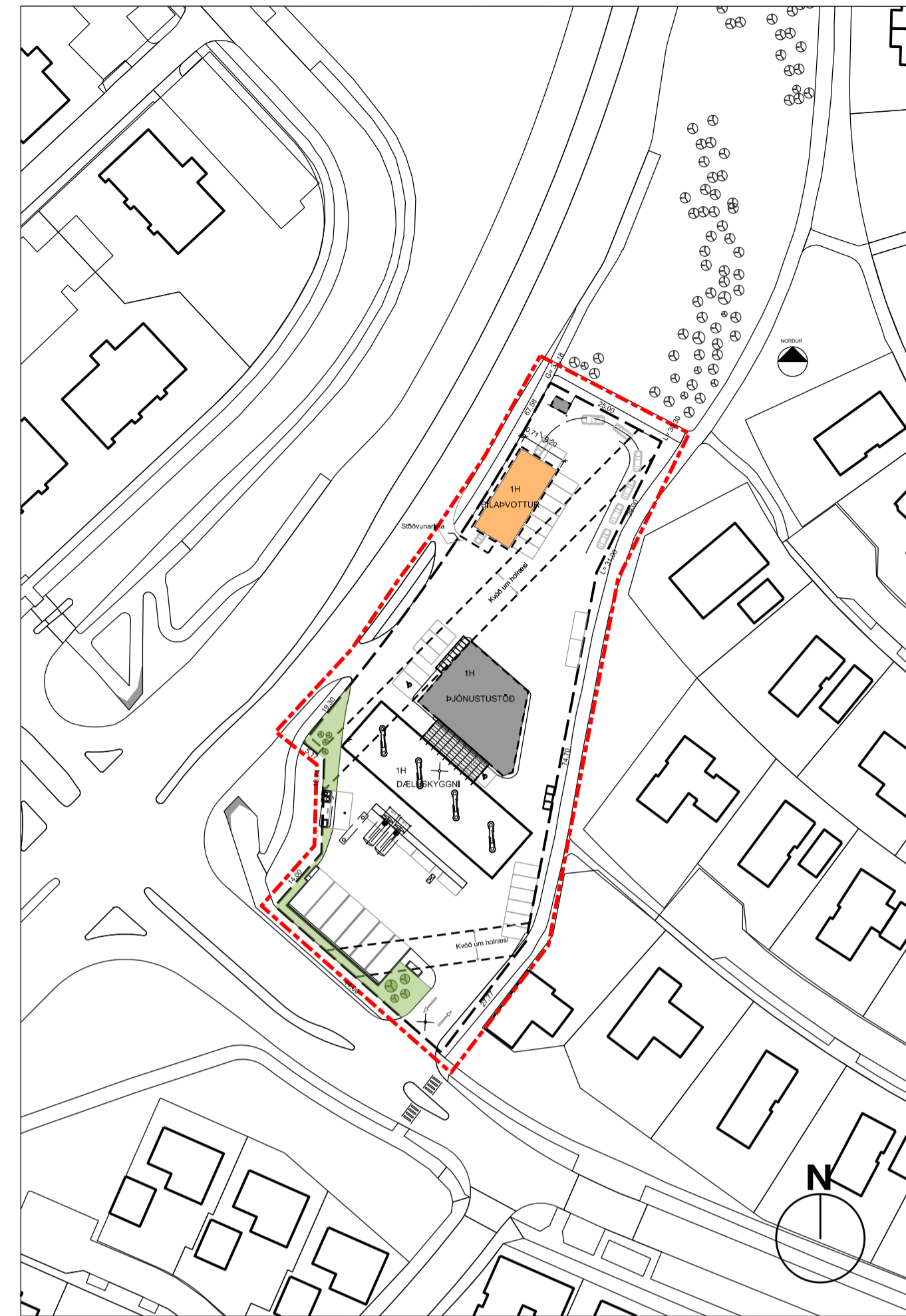
Deiliskipulagstillaga mkv. 1:1000

Gildandi deiliskipulag Í gildi er deiliskipulag „Efri hluti Foldahverfis“ samþykkt í borgarráði 3.12.1984 ásamt áorðnum breytingum. Í greinargerð er ekki fjallað um Fjallkonuveg 1. Á skipulagsuppdrætti er gert ráð fyrir bensínafgreiðslu, þvottaplani og þvottastöð.