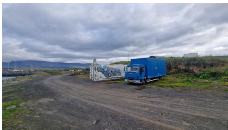
Mynd 6. Svæði C Gufunesi. Esjan í bakgrunni og gamla áburðarbryggjan lengst t.v.