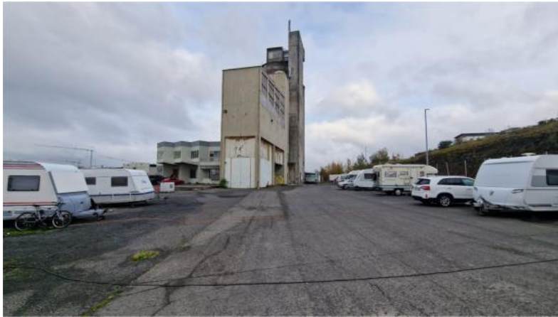
Mynd 2. Sævarhöfði horft til Austurs. Í baksýn er hús þar sem aðgangur er að Þvottavél.