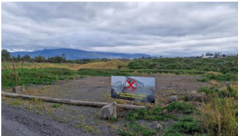
Mynd 9. Svæði F Gufunesi. Horft til N í jaðri Skemmtigarðsins til móts við tvö kúluhús.