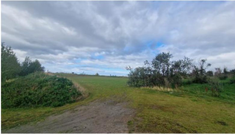
Mynd 7. Svæði D Gufunesi. Tjaldsvæði (grasflöt) innan Skemmtigarðsins.