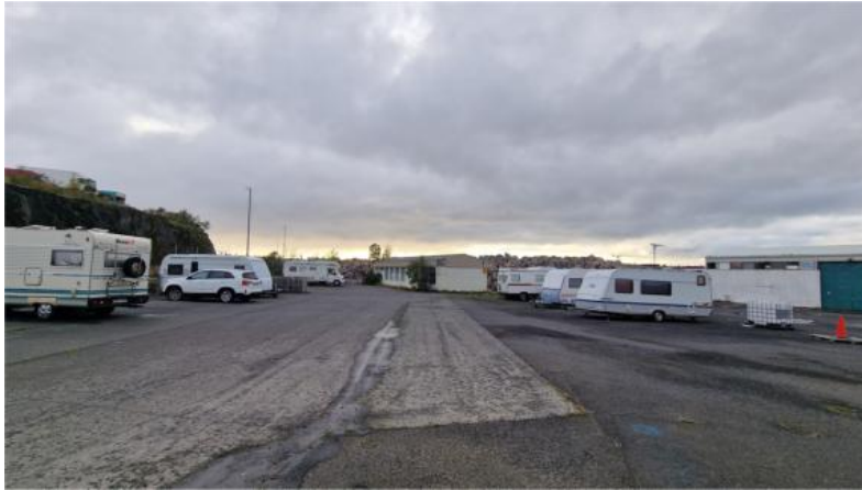
Mynd 1. Sævarhöfði horft til Vesturs. Ný grjóthrúga aftast á myndinni.