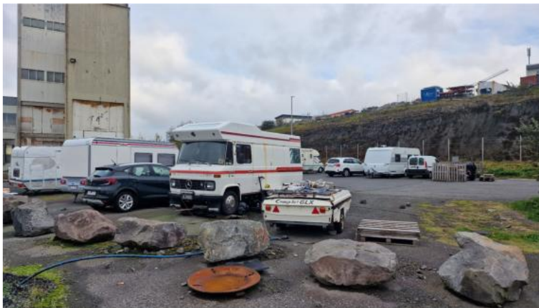
Mynd 3. Sævarhöfði horft til Suðurs.