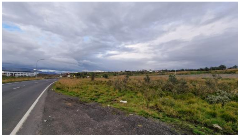
Mynd 5. Svæði B Gufunesi. Horft frá vegi næst Sorpu til NA. Nýr hjólástigur t.h. á myndinni.