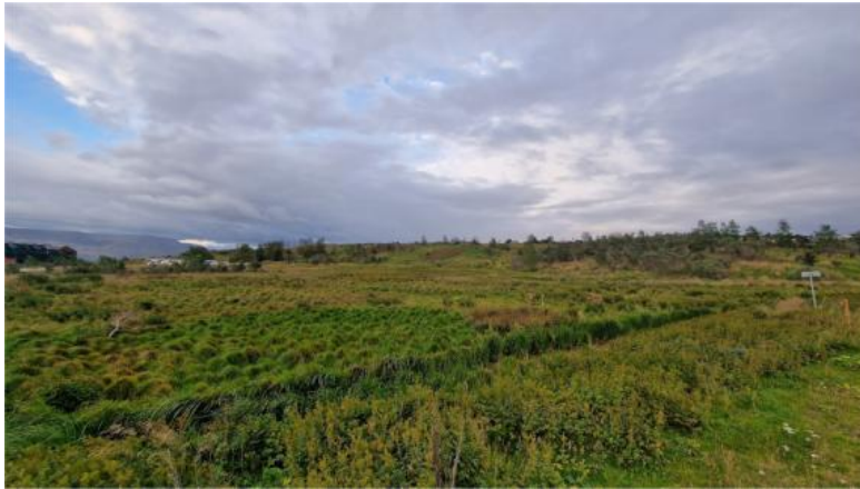
Mynd 4. Svæði A Gufunesi. Horft frá vegi til NA. Smáhýsin sem fyrir eru fjærst t.v.