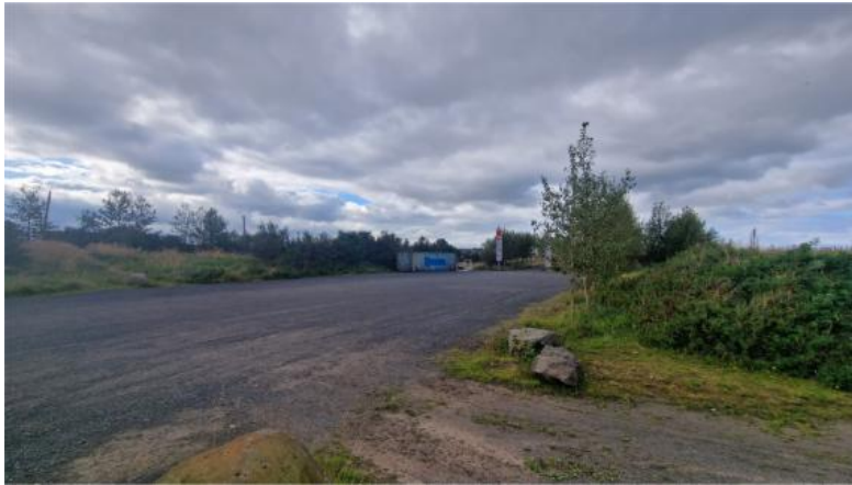
Mynd 8. Svæði E Gufunesi. Myndin er tekin á sama stað og mynd 7, en horft til SV í stað NV.