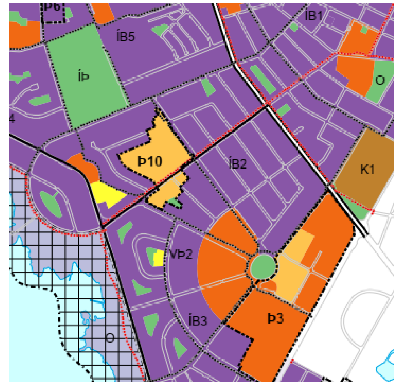
Hluti af aðalskipulagi Reykjavíkur 2010-2030.