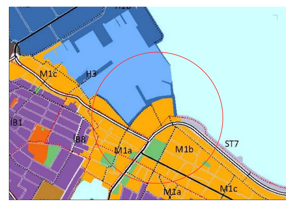
Aðalskipulag Reykjavíkur 2010 - 2030.

Breytingin felst í eftirfarandi: 1. Skipulagsreitir er minnkaður um 451m 2 við það að skipulagsmörk í Pósthússtræti eru færð nær lóðinni Austurbakka 2 þannig að þau liggja 3 metra frá lóðarmörkum.