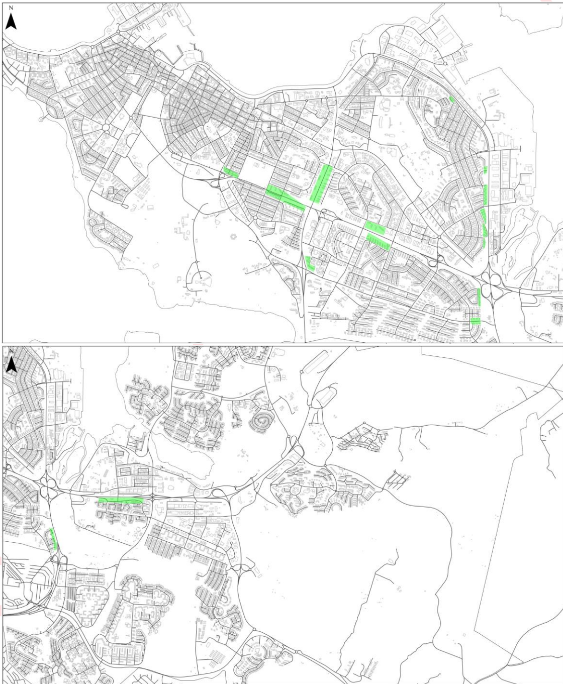
Mynd 2 og 3. Svæði í forgangi

Horft er til svæða þar sem umferðarhávaði veldur íbúum verulegu ónæði og reiknast yfir L_{den} = 68 dB, t.d. á stöðum þar sem byggð er í nágrenni við stofnbrautir. Á þeim svæðum verða skoðaðar mögulegar hljóðvarnir eða lagfæringar á þegar byggðum hljóðvörnum. Áhersla verður lögð á að bæta hljóðstig á íbúðalóðum.