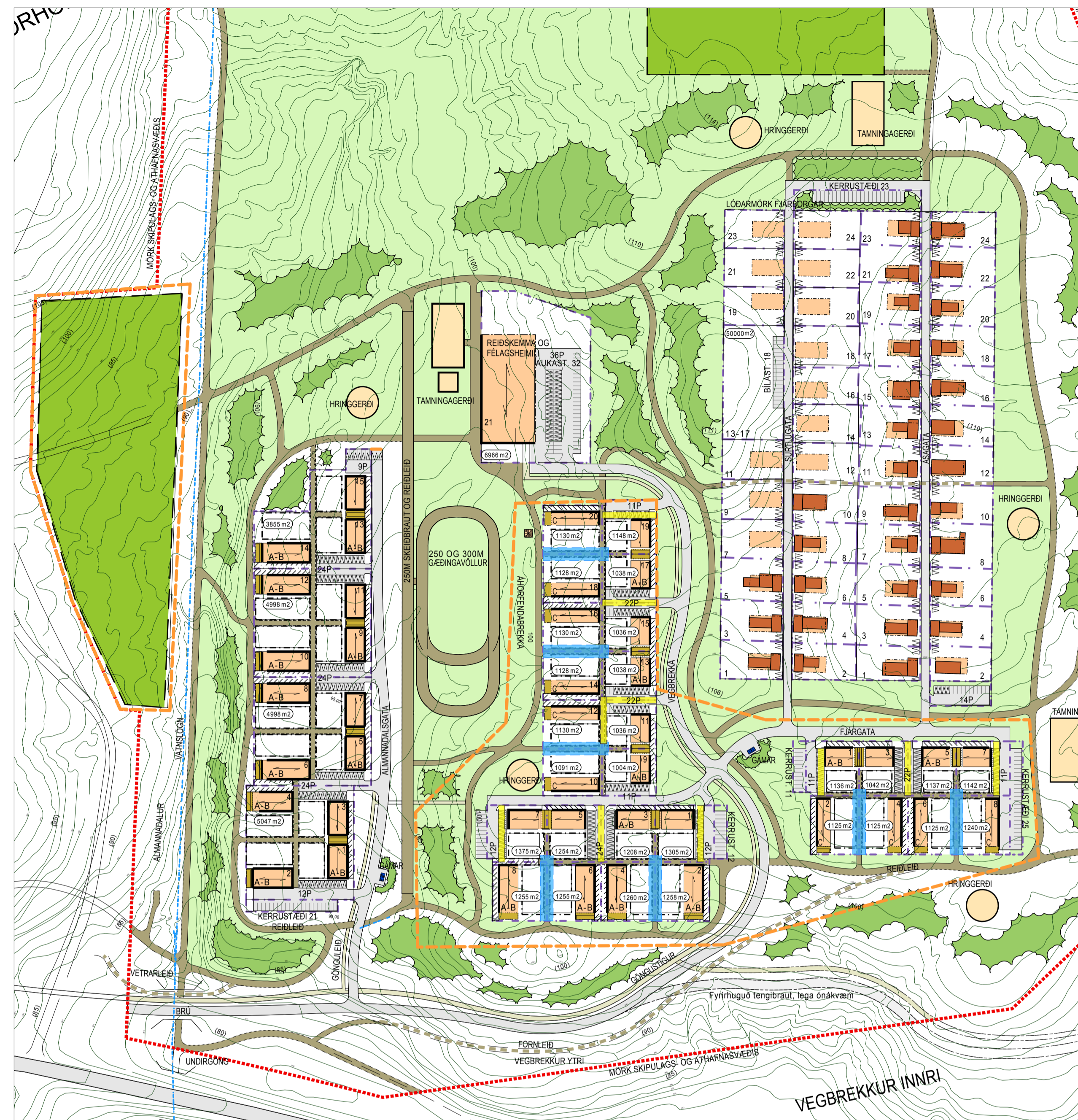
Tillaga að breytingu deiliskipulags, sjá nánar í greinargerð mkv. 1:2000

Bætt er við: Bindandi lína er á 2 vegu í stað þess að vera allur byggingarreiturinn, sjá á uppdrætti.