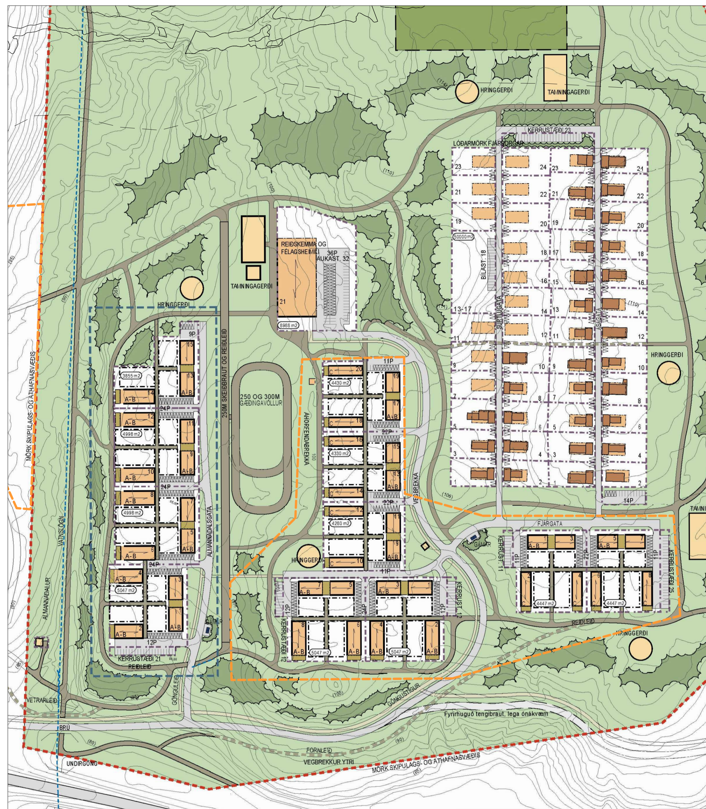
Gildandi deiliskipulag Hesthúsabyggð á Hólmsheiði, Almannaadalur dags B. deildar augl 12.11.2003, síðast breytt 19.07.2011. mkv 1:2000