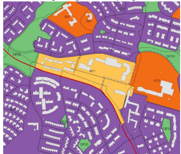
Landnotkun í Aðalskipulagi Reykjavíkur 2040 og aðalgötur íbúðarbyggðar (rauðar línur).

Fjölbreytt verslun, m.a. sérvöruverslun og þjónusta og starfsemi sem þjónar heilum borgarhluta. Verslun og þjónusta, skrifstofur, stofnanir, afþreying og íbúðir, einkum á efri hæðum bygginga. Matvöruverslanir heimilrar. Veitingastaðir í flokki I og II eru heimilir og veitingastaðir í flokki III geta verið heimilir, þó með takmörkuðum opnunartíma til kl. 1 um helgar og 23 á virkum dögum. Gististaðir í flokki I–III eru heimilir og eftir atvikum gististaðir í flokki IV, sjá töflu 19.3. Sjá nánar kafla 6 í greinargerð aðalskipulags.