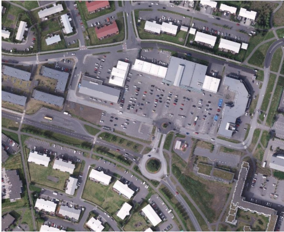
Núverandi staða og afmörkun skipulagsvæðis.

Svæðið einkennist af lágum eins til tveggja hæða samfelldum byggingum, stóru bílastæði og gróðurlitlu svæði með almennt gráu yfirbragði. Svæðið byggist upp frá árinu 1997-1999 og eru byggingarnar frá þeim tíma.