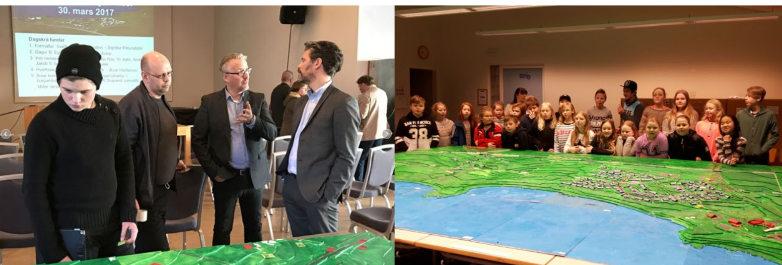
Mynd 3.2. Íbúafundur með borgarstjóra var 30. mars 2017 og krakkar úr Klébergsskóla við módel af Grundahverfi og nágrenni sem þau byggðu undir leiðsögn sérfræðinga hverfisskipulag í mars 2017.

Ekki var meira unnið í hverfisskipuagi í BH10 þá vegna þess að ákveðið var á vormánuðum 2017 að einbeita sér að því að fullgera eitt hverfisskipulag í BH7.Árið 2017