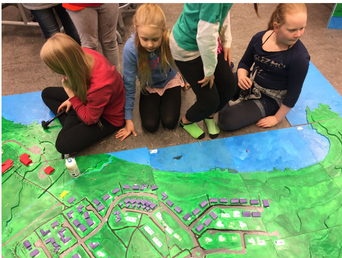
Mynd 3.4. Krakkar í Klébergsskóla að vinna við módelger í mars 2017.

Þegar gerð eru módel af einu hverfi er þeirri aðferð beitt að fá nemendur í 6. bekk til að smíða líkans af sínu hverfi undir leiðsögn starfsmanna hverfisskipulags og í samráði við viðkomandi umsjónarkennara. Sú vinna tekur um eina viku í hverjum grunnskóla. Við upphaf vinnunnar fá nemendur stutt fræðsluerindi um arkitektúr, skipulagsmál, vistvænar samgöngur og græn svæði í borginni. Fræðsluerindin eru haldin af starfsmönnum umhverfis- og skipulagssviðs. Nemendur mála módelgrunna, búa til hús úr pappír og tré úr vatnkúlum og tannstönglum. Í Klébergsskóla á Kjalarnesi fór þessi vinna fram í mars 2017.