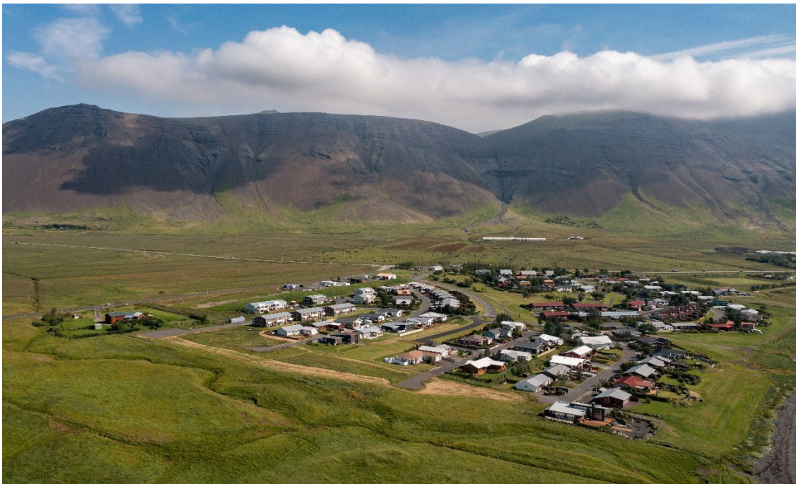
Mynd 3.5. Grundarhverfi og nágrenni séð úr lofti frá vestri.

Gallup leggur mikla áherslu á að viðskiptavinurinn fylgist með umræðum hópanna, en það er gert á skjá í öðru rými með vitund og vilja þátttakenda í rýnihópunum. Auk þess eru umræður teknar upp en starfsmaður Gallup gerði síðan orðrétt afrit af samræðum í rýnihópunum ásamt stuttum útdrætti. Hvort tveggja er síðan afhent fulltrúum hverfisskipulagsins og notað við úrvinnslu og áframhaldandi tillögugerð.