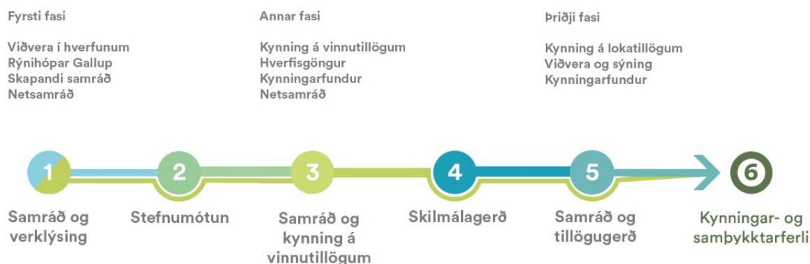
Mynd 3.1. Samráðsferli hverfisskipulags er skipt í þrjá fasa og vinnuferli hverfisskipulags í seks skref sjá mynd.

Einn mikilvægasti hópurinn sem samráðinu var ætlað að ná til voru íbúar og hagsmunaaðilar í hverfunum. Eins og gefur að skilja er þetta samsettur hópur bæði hvað varðar aldur, áhugasvið og þarfir. Við skipulag samráðsins hafa komið fram ábendingar um að hefðbundnir íbúafundir með kynningum, framsögum og fyrirspurnum næðu ekki að virkja íbúa nægilega vel. Sérstaklega var þar horft til aðferða sem næðu betur til barna og ungmenna, barnafjölskyldna og eldri borgara en allt eru þetta mikilvægir aðilar í hverju hverfi. Bent hefur verið á að hefðbundnir íbúafundir henta ekki þessum hópum sérlega vel. Hefðbundnir íbúafundir voru hins vegar taldir henta betur fólki með sterkar skoðanir sem er fært í að tjá sig með framsögu á opinberum fundum. Af þessum sökum hafa verið innleiddar nokkrar nýjungar í samráði sem hafa þann tilgang að ná til sem flestra og gefa þeim rödd í skipulagsferlinu. Farið verður yfir þessar aðferðir hér að aftan en þær skiptast í þrjá fasa eftir tímabilum en vinna við fyrsta fasann er að hefjast og verður gert grein fyrir öllum fösam samráðsins þegar þeirri vinnu er lokið.