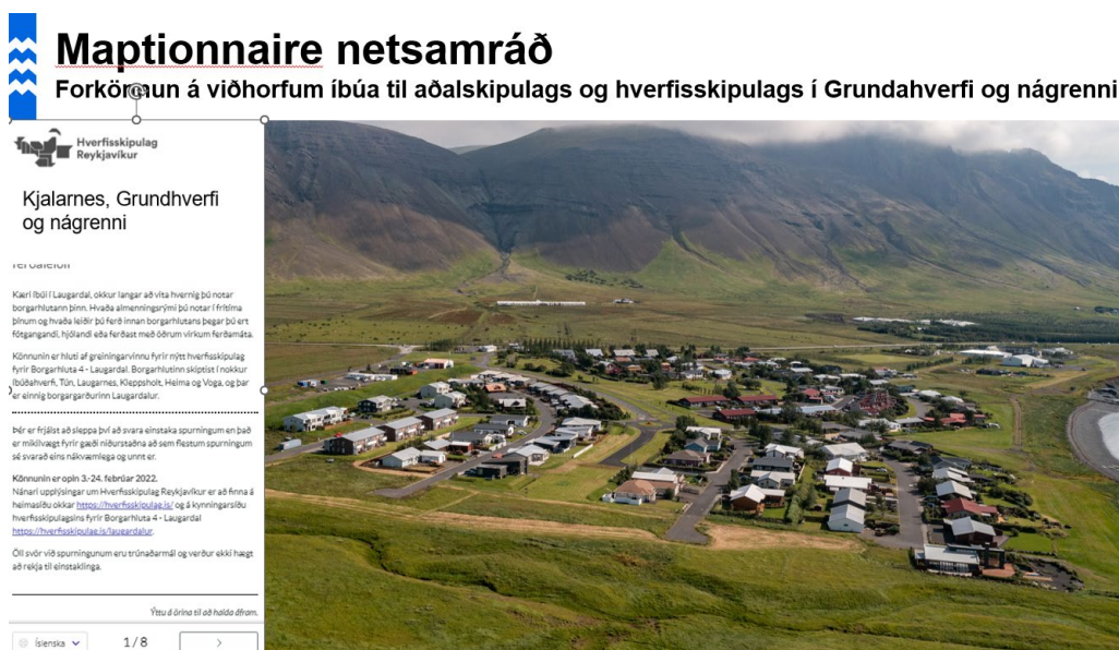
Mynd 3.6. Netkönnun er ein af samráðsaðferðunum.

Til þess að ná til sem flestra er notað sérstakt netsamráðstæki sem heitir Maptionnaire þar sem varðað er fram spurningum sem íbúar geta svarað.