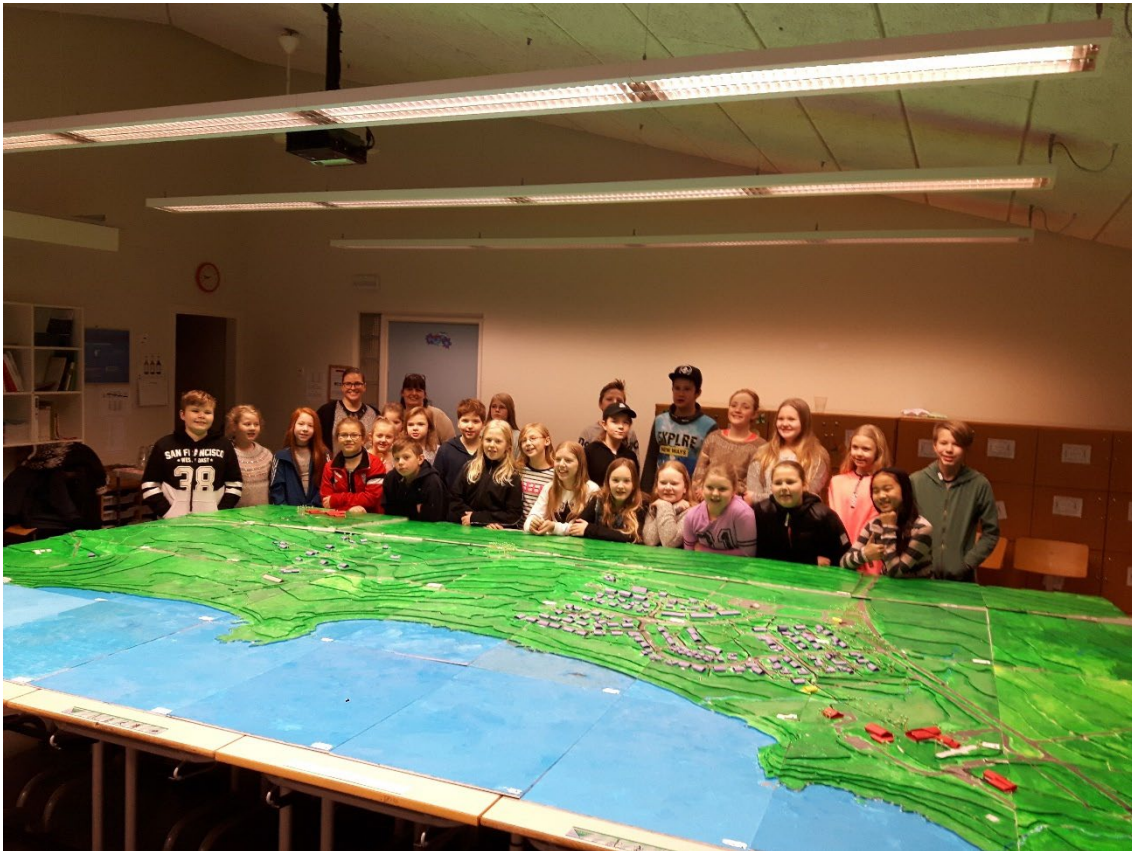
Mynd 3.6. Krakkar í Klébergsskóla við módel af hverfinu og næsta nágrenni í mars 2017. Þetta módel verður notað í samráði við íbúa og hagsmunaaðila í fyrirhuguðu samráði 2025.

Gerð verður grein fyrir samráðs- og kynningarferli þriðja fasa þegar þar að kemur.