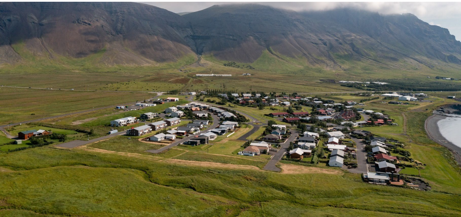
Mynd 1.2. Grundarhverfi og nágrenni séð úr lofti frá vestri. Lengst í austri er Klébergsskóli, íþróttahús, sundlaug og félagsheimili.

Í skipulagsvinnu verður jafnframt mótuð leiðbeinandi stefna fyrir þróunarsvæði borgarhlutans sem taki mið af ofangreindri stefnu og áherslum.